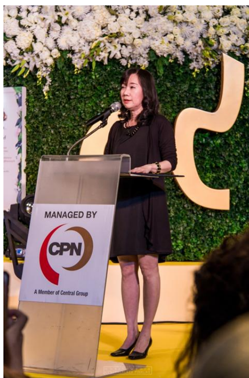
รูป 4.5 GM ของศูนย์การค้า เซนทรัล ปิ่นเกล้า กล่าวเปิดงาน

4.2.1 ขั้นตอนการจัดงาน Flora in the city 2016 จัดตั้งแต่วันที่ 7 ธันวาคม ถึง 13 ธันวาคม 2559 ภายใต้คอนเซ็ปต์ พระบรมราโชวาท ที่ผลิตานกลางใจปวงประชา เพื่อให้เข้ากับช่วงถววยความอาลัย