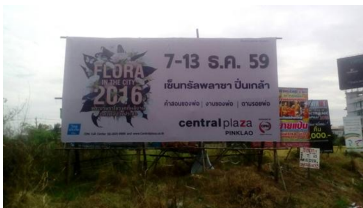
รูป 4.4 สื่อโฆษณาที่ใช้ภายนอกศูนย์การค้า เซ็นทรัลพลาซ่า ปิ่นเกล้า