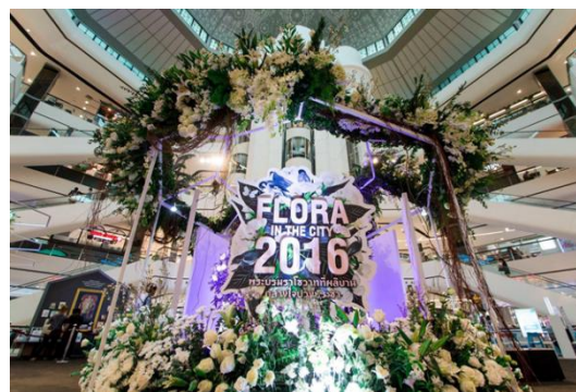
รูป 4.7 บรรยากาศในงาน

4.2.2 ขั้นตอนการจัดงาน Flora in the city 2016 ทุกๆวัน ตลอดแคมเปญ มีการแจกบัตรสมาชิกและการ์ด 9 คำสอนของพ่อบริเวณในงานจัดแสดงและจบแคมเปญแล้วการ์ด 9 คำสอนของพ่อจะมีแจกอยู่ที่ จุด Redemption ณ บริเวณชั้น 1 ข้างลิฟท์แก้ว