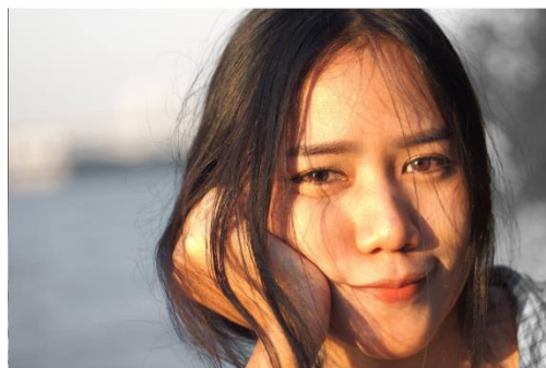
รูปภาพที่ 3.7 พนักงานตำแหน่ง ผู้ช่วย Graphic Design