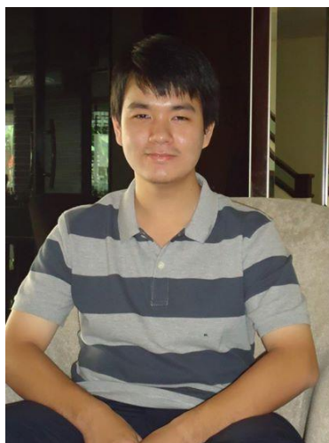
รูปภาพที่ 3.6 พนักงานตำแหน่ง หัวหน้า Graphic Design