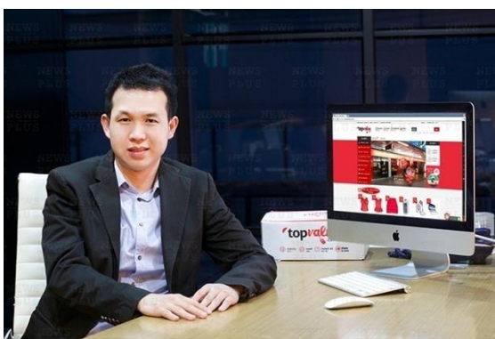
รูปภาพที่ 3.3 ผู้ก่อตั้งบริษัท ทีโอปแวลู คอร์ปอเรท จำกัด

ช้อปหน้าร้านกับเรา : เรามีหน้าร้านป๊อปอัพสตรีตซึ่งตั้งอยู่บน BTS สยาม ระหว่างทางออก 3,4 และทางออก 5,6 เพื่อให้ลูกค้าสามารถเข้าถึงเราได้โดยตรง เป็นจุดศูนย์กลางในการรับสินค้า สั่งซื้อสินค้า และบริการระหว่างผู้ซื้อกับผู้ขายที่ทำธุรกรรมผ่านทาง topvalue.com เพื่อสร้างความเชื่อมั่นและความพึงพอใจให้กับคุณ