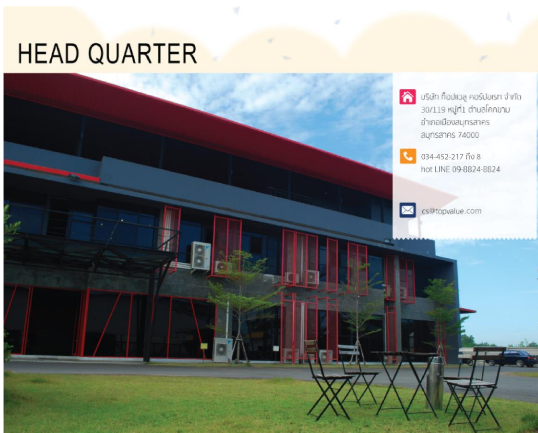
รูปภาพที่ 3.1 สถานที่ตั้ง บริษัท ท็อปแวลู คอร์ปอเรท จำกัด