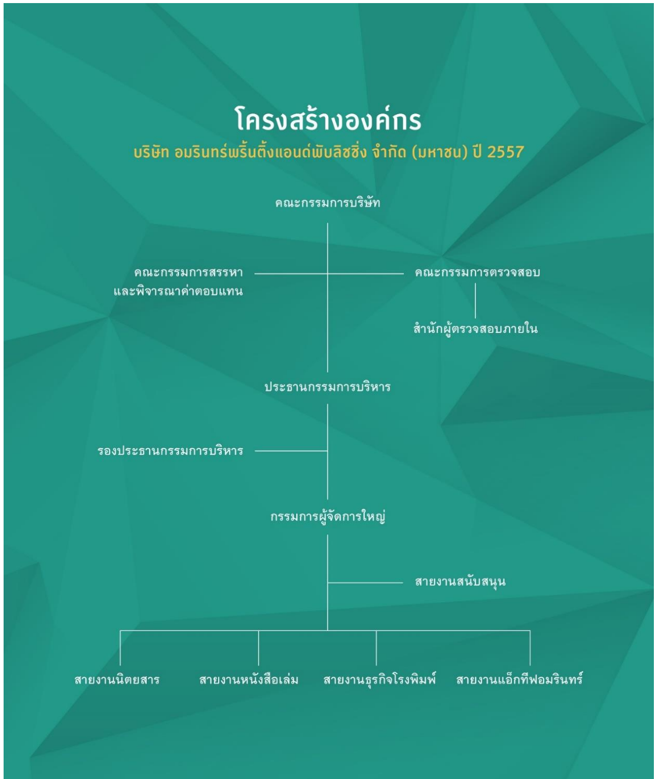
3.7 รูปภาพรูปแบบการจัดองค์กรและการบริหารงานองค์บริษัทอมรินทร์