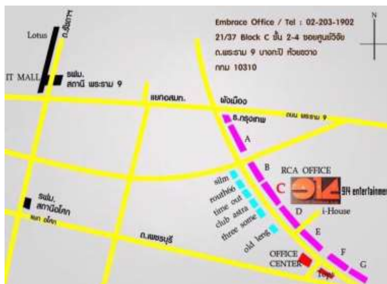
รูปที่ 3.2 แผนที่บริษัท 914 Entertainment จำกัด