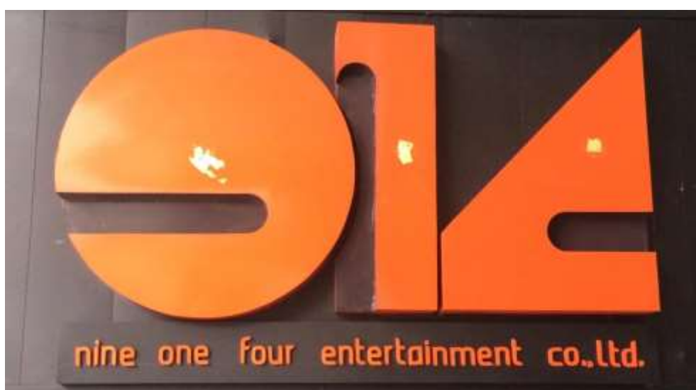
รูปที่ 3.1 ตราสัญลักษณ์โลโก้ บริษัท 914 Entertainment จำกัด

3.1.2 ที่ตั้งของสถานประกอบการ 21/37 ชั้น 1 ลอย ซอย ศูนย์วิจัย พระราม 9 แขวง บางกะปิ เขต ห้วยขวาง กรุงเทพมหานคร 10310