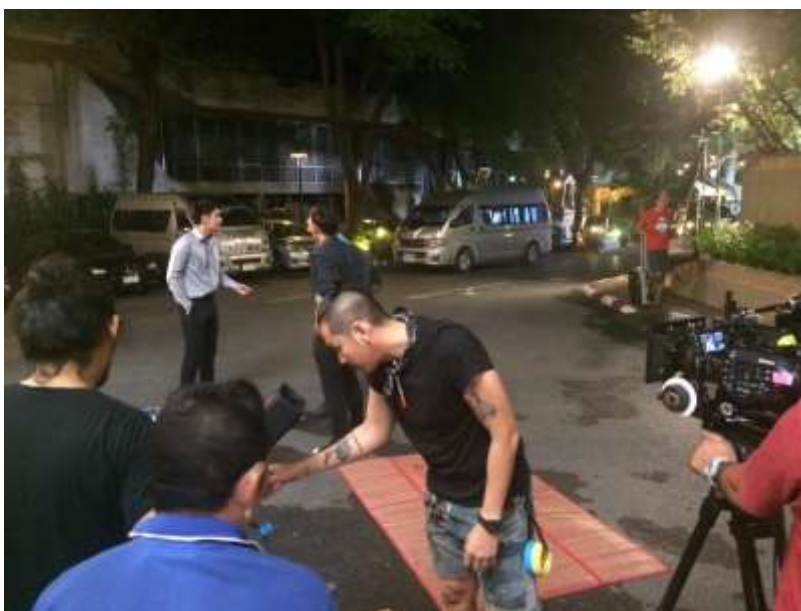
รูปที่ 4.6 คู่มือหน้าเซตภายในกอง

คู่มืออยู่เบื้องหลังการถ่ายทำภายในกองถ่าย และประสานงานด้านสวัสดิการให้บริกรน้ำกับอาหารให้กับนักแสดงสมทบและทีมงานทุกคน