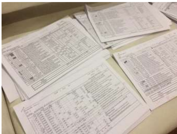
4.3 ประชุมการทำ breakdown และการวาง breakdown