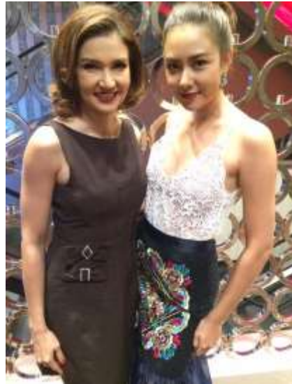
รูปที่ 4.9 เรียกนักแสดงจากห้องแต่งตัวมาหน้าเซ็ตเมื่อถึงเวลาเข้าฉาก