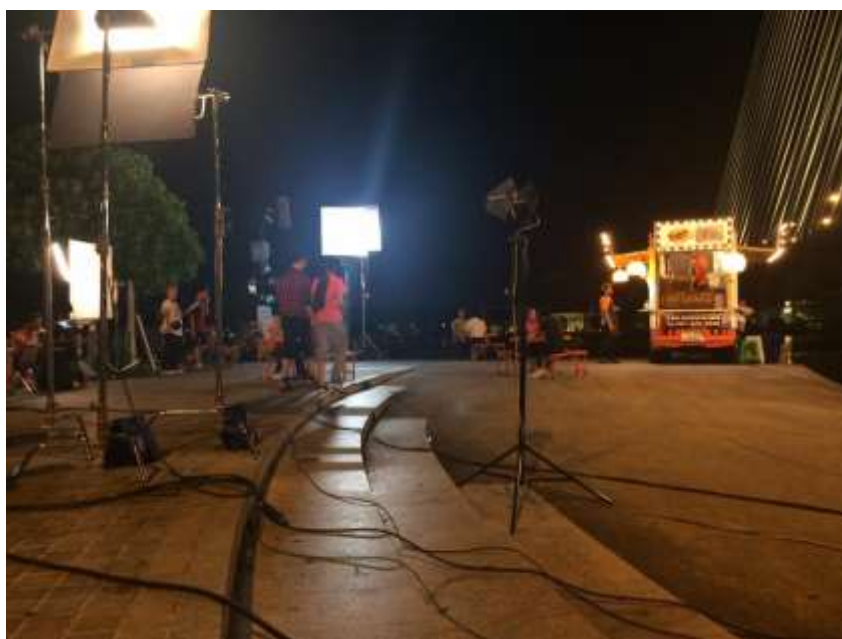
รูปที่ 4.8 เตรียมสถานที่อีกที่ไว้เพื่อการถ่ายทำในฉากต่อไป จึงต่อมีการเตรียมความเรียบร้อยเพื่อไม่ให้เป็นการเสียเวลา