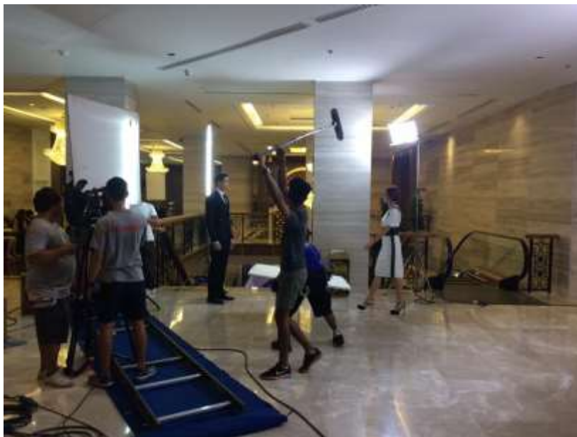
รูปที่ 4.5 คู่มือสวัสดิการภายในกองถ่าย

คู่มืออยู่เบื้องหลังการถ่ายทำภายในกองถ่าย และประสานงานด้านสวัสดิการให้บริกรน้ำกับอาหารให้กับนักแสดงสมทบและทีมงานทุกคน