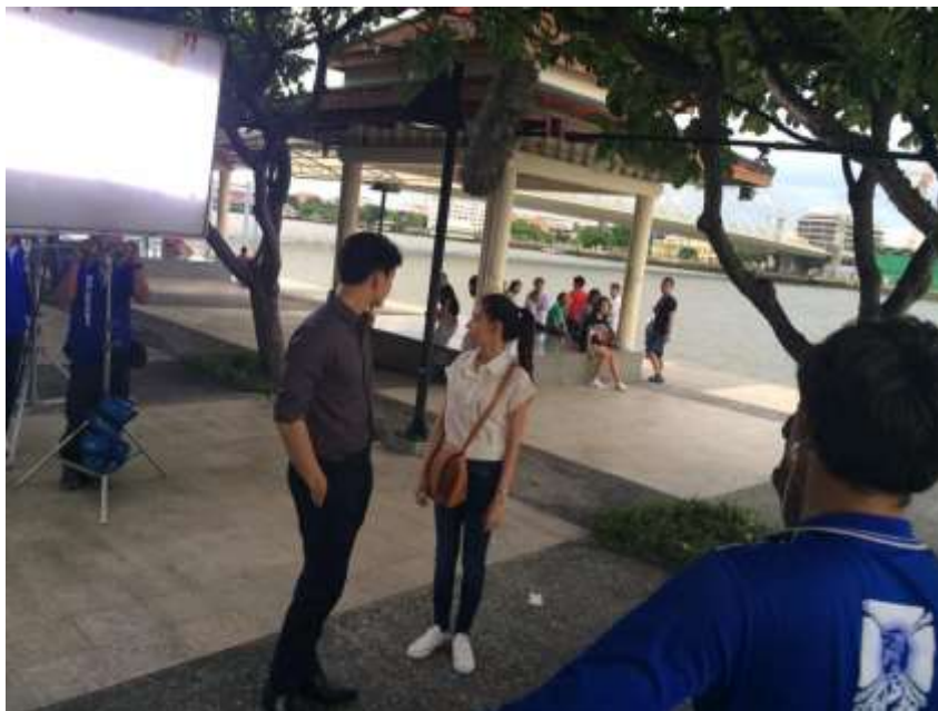
รูปที่ 4.7 คุณแลความเรียบร้อยทั้งหมดและก็ดูสถานการณ์รอบๆ ดูความเรียบร้อยทั้งหมดเนื่องจากถ่ายสถานที่สาธารณะ ซึ่งควบคุมยากหน่อยไม่ว่าจะเป็น คน เครื่องบิน เรือ