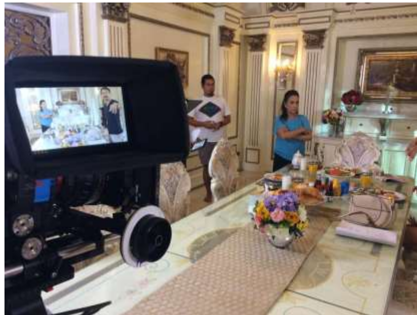
รูปที่ 4.10 เตรียมความพร้อมเรียบร้อยก่อนถ่ายทำและตรวจเช็คดูความพร้อมเรียบร้อยอีกครั้ง ไม่อยากให้เกิดความผิดพลาดในขณะการถ่ายทำเพราะเวลาในการถ่ายทำมีจำกัด