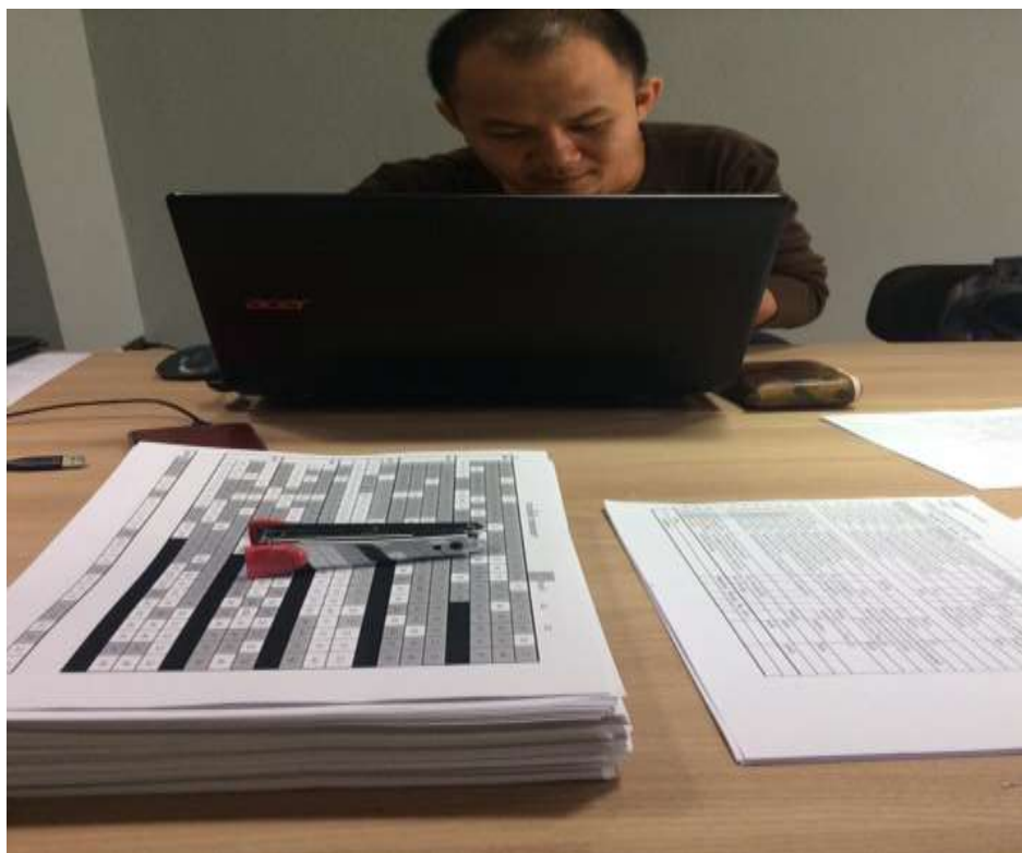
รูปที่ 4.1 พุดคุยกับพี่ที่ปรึกษาขององค์กร

ศึกษาการทำงานภายในบริษัท 914 Entertainment จำกัดเริ่มต้นจากพนักงานที่บริษัท 914 Entertainment จำกัด ได้เริ่มต้นจากการพูดคุยถึงขั้นตอนการทำงานหรือระเบียบขององค์กรและได้ แบ่งหน้าที่กันตามความเหมาะสมหลังจากนั้นก็ได้ประชุมวางแผนการถ่ายทำและได้ประชุมบท ละครเพื่อเตรียมการถ่ายทำในวันต่อไป ซึ่งในการประชุมนั้นทุกต้องต้องมี Breakdown เพราะต้องรู้ว่าต้องใช้นักแสดงคนไหนบ้างและจะต้องใช้สถานที่ไหนบ้าง