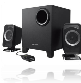
รูปที่ 3.5 ลำโพง