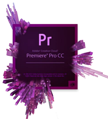
รูปที่ 3.6 Adobe Premiere Pro CC