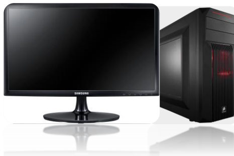
รูปที่ 3.4 รูป PC Desktop