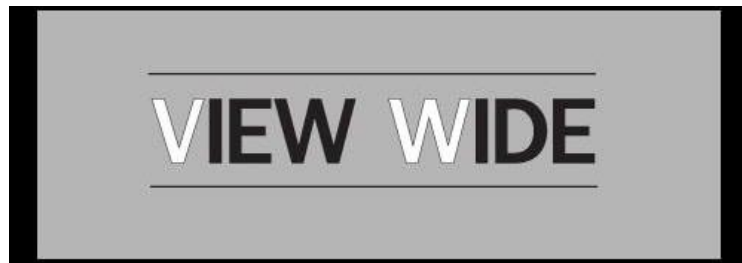
รูปที่ 3.1 โลโก้ของบริษัท วิว ไวด์ จำกัด

3.1.2 ที่ตั้งสถานที่ประกอบการ 889/5 ซอยอิสรภาพ 33 ถ.อิสรภาพ แขวงวัดอรุณ เขตบางกอกใหญ่ กรุงเทพมหานคร 10160