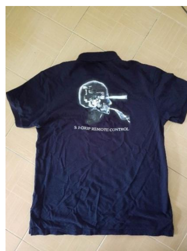
รูปที่ 3.2 เครื่องแบบของ บริษัท เอส.เจ.กริป เซอร์วิส จำกัด