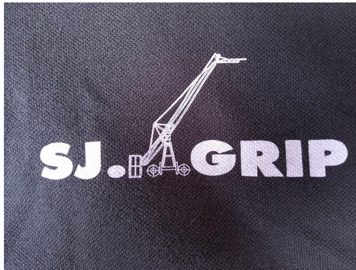
รูปที่ 3.1 ตราสัญลักษณ์โลโก้ บริษัท เอส.เจ.กริป เซอร์วิส จำกัด

บริษัท เอส.เจ.กริป เซอร์วิส จำกัด 110 ซอยรังสิต-นครนายก 10 ตำบลประชาธิปัตย์ อำเภอ ธัญบุรี จังหวัดปทุมธานี โทรศัพท์ 02-8848926 โทรสาร 02-8848926