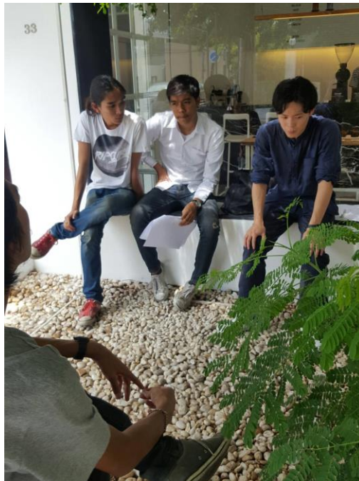
รูปที่ 4.ประชุมเรื่องบท

การประชุมบทในแต่ละครั้งจะมีทีมงานเข้าร่วมประชุม โดยการประชุมจะมีความละเอียดมาก เพราะต้องมาช่วยกันออกความคิดเห็นว่าในแต่ละซีนควรจะเป็นแบบไหนผู้กำกับต้องการให้ภาพออกมาเป็นอย่างไร อุปกรณ์ในซีนนั้นมีอะไรบ้าง และอาจจะมีการปรับแก้บทบ้างเล็กน้อย เมื่อทำการพูดคุยกันเป็นที่เรียบร้อยก็ยกหน้าที่ในการหาอุปกรณ์ต่างๆ ให้กับฝ่ายศิลป์ส่วนหน้าที่ของผู้จัดทำผู้กำกับจะส่ง Reference ของเสียงที่ต้องการให้ไปสืบค้นหามาให้ได้แนวทางที่เหมือนหรือคล้าย ๆ กับ Ref เพื่อให้ได้อารมณ์