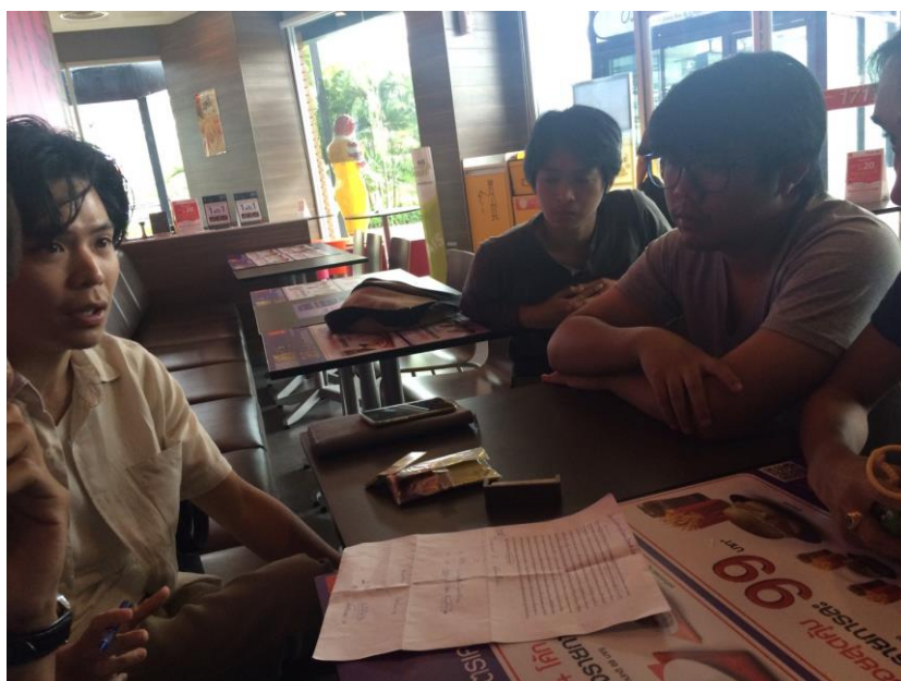
รูปที่ 4.3 Workshop

การทำงานในขั้นตอนนี้จำเป็นต้องพูดคุยกับพนักงานที่ปรึกษา และนำบทที่ได้มาอ่าน และลองแยกรายละเอียดในแต่ละชิ้นว่ามีอุปกรณ์อะไรบ้างที่ตัวละครต้องใช้ แล้วอุปกรณ์เข้าฉากของตัวละครว่าจะใช้ทำอะไรตอนไหนรวมถึงพูดคุยกันถึง Extra ที่จะต้องเข้ามาร่วมแสดงอยู่ในร้านกาแฟที่เราเลือกเป็น Location แล้วด้วยและผู้จัดทำได้ส่งเสียงที่ค้นหามาให้กับผู้กำกับแล้วปรากฏว่าโอเคใช้ได้แต่ สกอ อาจจะต้องไปเปลี่ยนใหม่เพราะผู้กำกับบอกว่าสื่ออารมณ์ไม่ค่อยดี