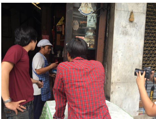
รูปที่ 4.10 บันทึกลีเสียงสัมภาษณ์

ในขั้นตอนนี้เป็นการเก็บเสียงสัมภาษณ์เพื่อนำไปตัดตอนต้นให้คนเข้าใจและได้ความรู้เกี่ยวกับทางด้านกาแฟก่อนมาว่าตั้งแต่โบราณกาแฟของไทยเป็นอย่างไรมีต้นกำเนิดมาอย่างไรทำไมถึงเลือกทำอาชีพนี้แต่ถ้าเมื่อถึงหน้างานก่อนที่จะเริ่มถ่ายทำผู้จัดทำได้ลองทำการทดสอบอุปกรณ์บันทึกเสียงว่าพร้อมที่จะทำงานหรือไม่ปรากฏว่าตัวรับเสียงมีคลื่นแทรกเข้าและไม่สามารทำให้หายๆได้ในตอนนั้นผู้จัดทำเลยแก้ไขปัญหาเฉพาะในตอนนั้นก็คือการใช้ IPHONE ถึงแม้คุณภาพจะไม่ดีเท่าแต่จำเป็นต้องใช้และสุดท้ายก็ออกมาโอเคถือเป็นโชคดีของผู้จัดทำด้วยที่ว่าช่วงนั้นไม่ค่อยมีรถยนต์สัญจรผ่านในช่วงถ่ายทำพอดี