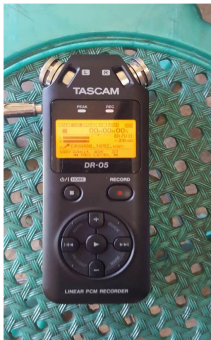
รูปที่ 4.6 ทดสอบตัวบันทึกเสียงก่อนเริ่มถ่ายทำ

เมื่อติดตั้งอุปกรณ์ทุกอย่างครบถ้วนก่อนจะถึงการถ่ายทำจริงเพื่อไม่ให้เกิดข้อผิดพลาดจำเป็นที่จะต้องทดสอบอุปกรณ์ก่อนไม่ว่าจะเป็นทั้งไมค์ตั้งตัวรับเสียงเพื่อไม่ให้เกิดปัญหาในการถ่ายทำจริงทีหลัง