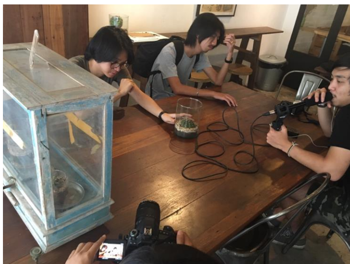
รูปที่ 4.7 ทดสอบเสียงโดยรวมก่อนเริ่มถ่ายทำ

เมื่อติดตั้งอุปกรณ์ทุกอย่างครบถ้วนก่อนจะถึงการถ่ายทำจริงเพื่อไม่ให้เกิดข้อผิดพลาดจำเป็นที่จะต้องทดสอบอุปกรณ์ก่อนไม่ว่าจะเป็นทั้งไมค์ตั้งตัวรับเสียงเพื่อไม่ให้เกิดปัญหาในการถ่ายทำจริงทีหลัง