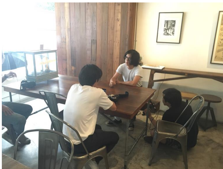
รูปที่ 4.8 บันทึกเสียงพูด

หลังจากทดสอบอุปกรณ์ทุกอย่างเรียบร้อยแล้วผู้กำกับก็เริ่มสั่งให้ถ่ายทำจริงในขั้นตอนนี้ผู้จัดทำได้เริ่มโดยการบันทึกเสียงพูดที่พูดตอบโต้กันระหว่าง 2 คนไปมาโดยใช้การนั่งที่พื้นแล้วเก็บอย่างไม่ห่างมากนักซึ่งตอนแรกผู้จัดทำจะทำการถืออัดด้านบนแต่พบว่าข้างบนมีเสียงอื่นเข้า