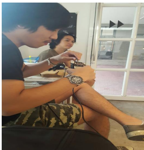
รูปที่ 4.5 ต่ออุปกรณ์ก่อนเริ่มถ่ายทำ

จัดเตรียมอุปกรณ์เสียงต่าง ๆ ที่ต้องใช้ในงานนี้