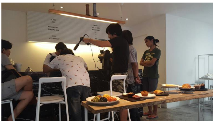
รูปที่ 4.9 บันทึกลีเสียงแยก (Foley)

อัดเสียง Foley เสียง Foley ก็การทำเสียงเท้าเดินหรือวิ่ง ส่วนมากจะทำขึ้นมาใหม่ เพราะเป็นการยากที่จะอัดได้อย่างชัดเจนในขณะที่ถ่ายทำ และรวมไปถึงเสียงเสื้อผ้าที่เกิดจากการเคลื่อนที่แต่ในงานครั้งนี้เราเก็บเสียง Foley ที่เครื่องชงกาแฟ กาน้ำร้อน เสียงเมล็ดกาแฟ เป็นต้น