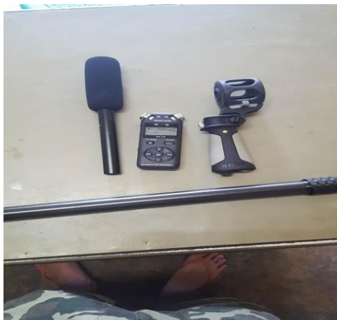
รูปที่ 4.4 จัดเตรียมอุปกรณ์

ในขั้นตอนนี้ก่อนที่จะเริ่มถ่ายทำต้องนำอุปกรณ์สำหรับบันทึกเสียงขึ้นมาติดตั้งให้พร้อมบันทึกและหลังจากจัดเตรียมอุปกรณ์ขึ้นมาแล้วต้องทำการทดสอบอุปกรณ์ว่ามีเรียบร้อยหรือมีปัญหาอาจจะมีเสียงแทรกเสียงรบกวนเข้าเป็นต้น