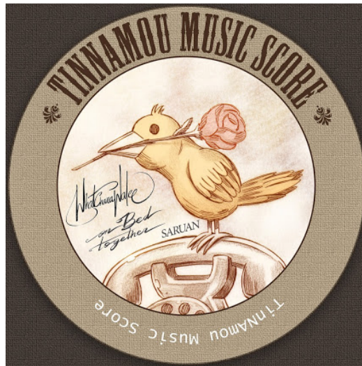
รูปที่ 3.1 บริษัท ทินนามู มิวสิคสกออร์ จำกัด