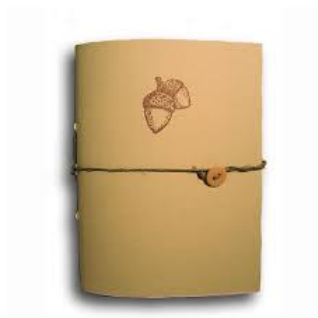
รูปที่ 3.5 สมุดบันทึก