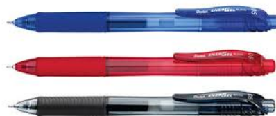
รูปที่ 3.6 ปากกา