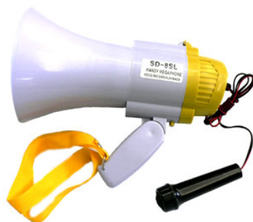
รูปที่ 3.4 โทรโข่ง