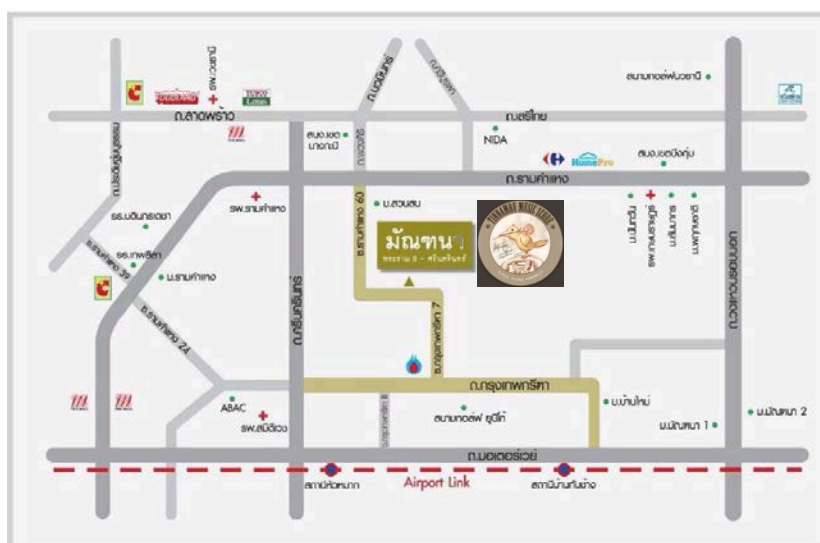
รูปที่ 3.2 แผนที่บริษัท ทินนามู มิวสิคสโตร์ จำกัด