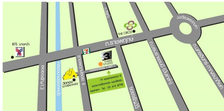
รูปที่ 3.2 แผนที่บริษัททริสตูดิโอ จำกัด