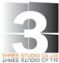
รูปที่ 3.1 ตราสัญลักษณ์ (logo) บริษัท บริษัททริสตูดิโอ จำกัด