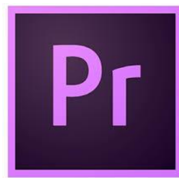
รูปที่ 3.8 โปรแกรม Adobe Premiere Pro