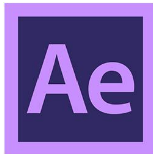
รูปที่ 3.10 โปรแกรม Adobe After Effect