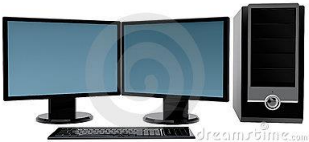
รูปที่ 3.4 PC

3.8.1.1 PC /AMD FX 6100 6Core /Ram 8GB /HDD 2 TB /VGA AMD RADEON HD7700 x2 /LG IPS235 x2