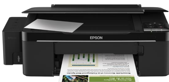
รูปที่ 3.5 เครื่องปริ้น Epson Stylus Photo R230 Series