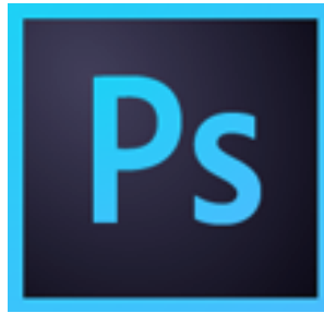
รูปที่ 3.9 โปรแกรม Adobe Photoshop