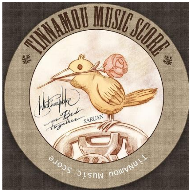
ภาพที่ 3.1 โลโก้บริษัท ทินนามู มิวสิคสกอ์ จำกัด

3.1.1 ชื่อสถานประกอบการ บริษัท ทินนามู มิวสิคสกอ์ จำกัด