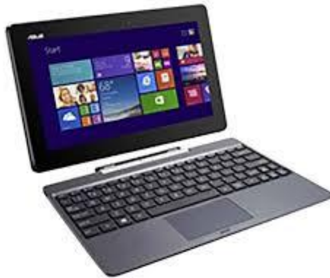
ภาพที่ 3.7 โน้ตบุ๊ก