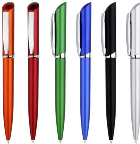
ภาพที่ 3.6 ปากกา