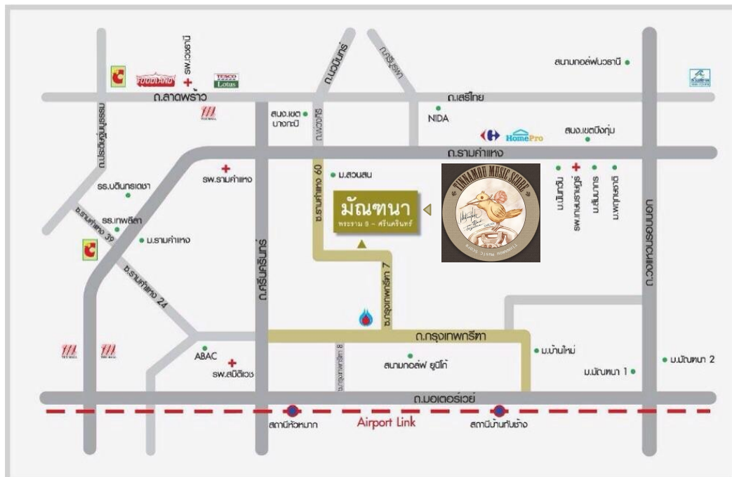
ภาพที่ 3.2 แผนที่บริษัท ทินนามู มิวสิคสกอ์ จำกัด

3.1.2 ที่ตั้งสถานประกอบการ 50/491 หมู่บ้านมณทนา (พระราม9-ศรีนครินทร์) ซ.กรุงเทพกรีฑา7 แขวง ห้วยหมาก เขต บางกะปิ กรุงเทพมหานคร หมายเลขโทรศัพท์ 027324178