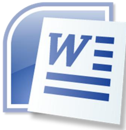
ภาพที่ 3.8 โปรแกรม Microsoft Word สำหรับพิมพ์เอกสาร