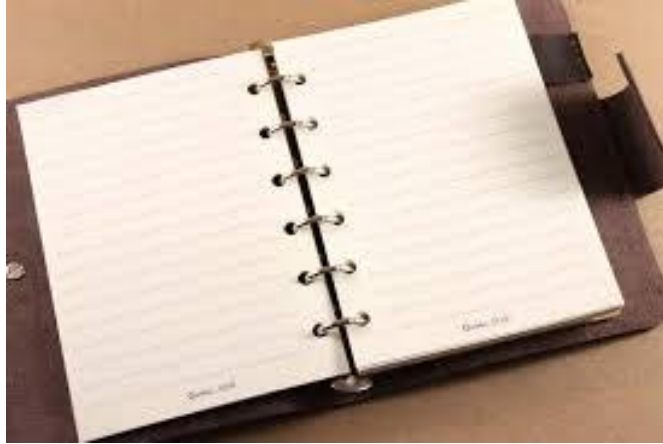
ภาพที่ 3.5 สมุดจดบันทึก