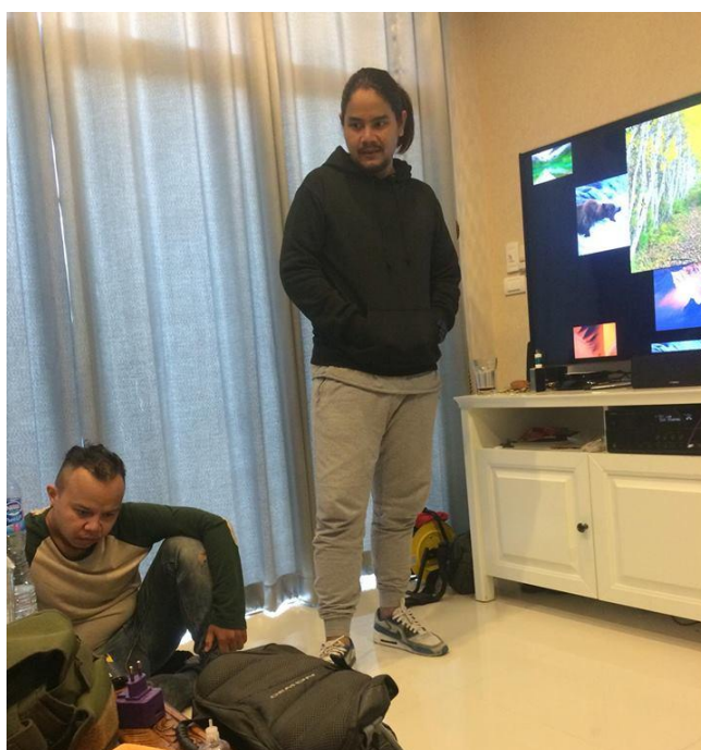
ภาพที่ 4.2 ประชุมเกี่ยวกับปัญหาของศิลปิน

ทางบริษัทได้แจ้งว่า ศิลปินวง On Bed together ได้เคยปล่อย Single ออกมาแล้ว 1 เพลง ชื่อ เพลงฝนนาฬิกา ซึ่งมียอดผู้ชม ใน Youtube ถึง 5,039,565 คน และได้ไปโปรโมทเพลงตามสื่อต่างๆ ได้แก่ เว็บไซต์ kapook , เว็บไซต์ sanook , Virgin Hitz 95.5 , Virgin star FM98 , รายการบ้านพระราม4 ทางช่อง3 SD นอกจากนี้ ศิลปินวง On bed together ยังเคยเข้าชิงรางวัล Seed Awards ครั้งที่10 อีกด้วย แต่คนส่วนใหญ่ก็ยังไม่รู้จักตัวศิลปิน