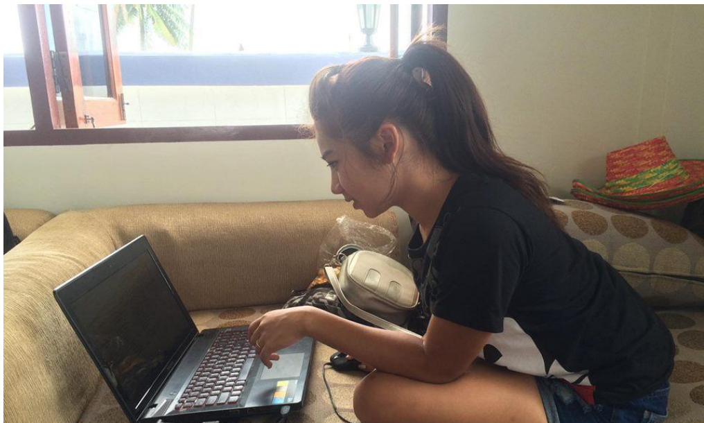
ภาพที่ 4.1 ค้นหาข้อมูลเพื่อเตรียมความพร้อม

หลังจากที่ได้ศึกษาแนวคิดเกี่ยวกับรูปแบบของมิวสิกวิดีโอแล้ว ได้นำมาประยุกต์ใช้คือ มิวสิกวิดีโอโปรโมทศิลปินวง On bed together ใช้รูปแบบตัวละครเป็นหลัก ซึ่งตัวละครในที่นี่หมายถึง ตัวศิลปินเอง เพื่อที่จะส่งเสริมภาพลักษณ์ของ ศิลปิน โดยให้ศิลปินแสดงบทบาทเฉพาะของตนเองออกมาในรูปแบบของ “ผู้ควบคุมชะตาชีวิตของตนเองไว้ได้ ” เพราะมีเจตนาที่จะสร้างภาพลักษณ์ให้ศิลปินมีบุคลิกภาพและความเฉลียวฉลาดทางปัญญา เพื่อให้ผู้รับสารได้รู้สึกชื่นชมและเข้าถึงความต้องการของ กลุ่ม เป้าหมายให้มากที่สุด