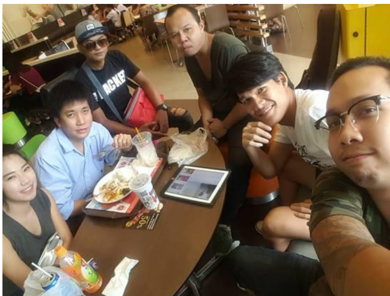
ภาพที่ 4.6 ประชุมงานครั้งสุดท้ายก่อนถ่ายทำ

ก่อนถ่ายทำ ผู้ควบคุมการผลิต จำเป็นที่จะต้องนัดประชุมก่อนเพื่อที่จะทำให้ทีมงานทุกคน เข้าใจในภาพรวมของงานให้ตรงกันมากที่สุด เพื่อที่จะลดข้อผิดพลาดต่างๆในการทำงาน