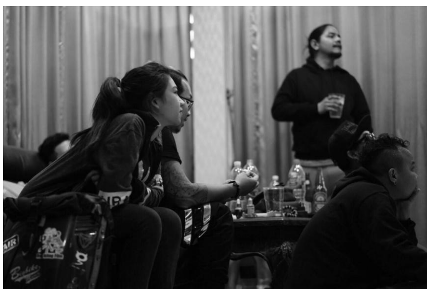
ภาพที่ 4.3 ประชุมบท

หลังจากที่ได้เสนอรูปแบบของมีวิสัยทัศน์โอโปรโมทศิลปิน On bed together ให้กับทางบริษัทแล้ว บริษัทได้เห็นด้วยกับรูปแบบที่ได้นำเสนอไป ทางบริษัทจึงรับหน้าที่ไปเขียนบทด้วยตัวเอง และเมื่อได้บทมา จึงต้องทำการประชุมถึงความเป็นไปได้ในการถ่ายทำ