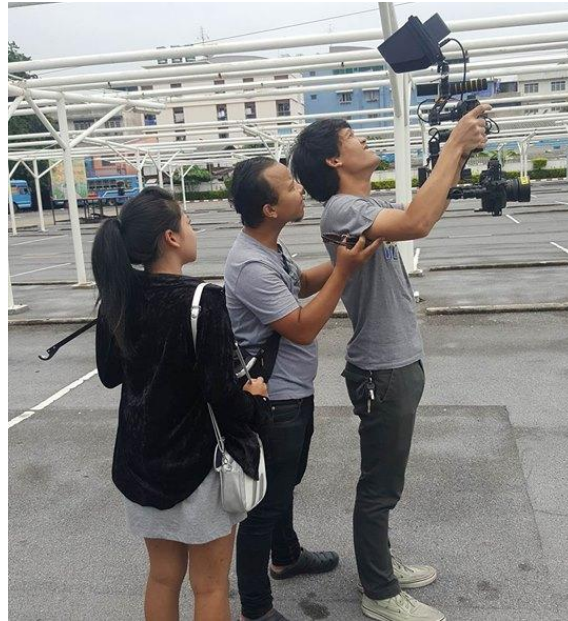
ภาพที่ 4.7 คู่มือในส่วนของการถ่ายทำ