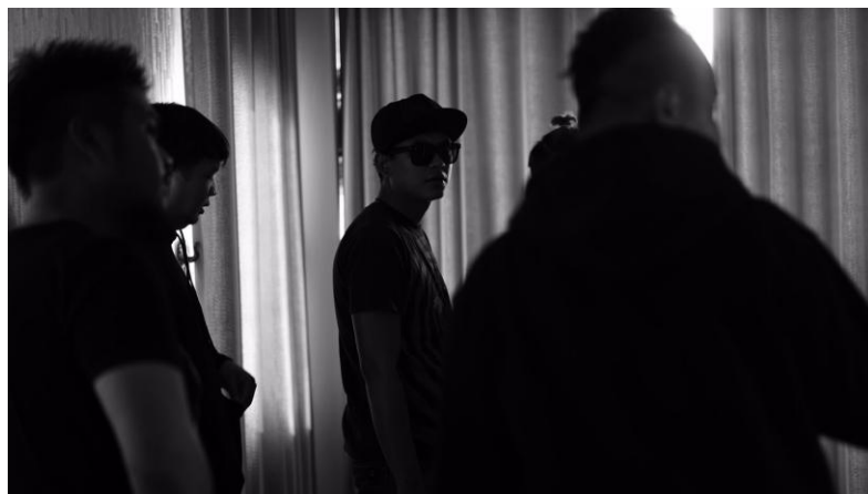
ภาพที่ 4.5 Block shot

ในส่วนของการ Block Shot ผู้ควบคุมการสร้างจะต้องทำตามบทบาทหน้าที่ของตัวเองคือ ในวันBlock Shot จะต้องคอยประสานงานกับทุกๆฝ่ายตลอดเวลา เพื่อให้ทุกฝ่ายทำงานเสร็จตรงตามเวลาที่กำหนดไว้