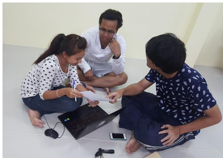
ภาพที่ 4.8 ประชุมปัญหาที่เกิดขึ้น

เมื่อทำการถ่ายทำในแต่ละวันเสร็จแล้ว ทีมงานจะต้องมาคุยกันเกี่ยวกับปัญหาที่เกิดขึ้น เพื่อที่จะหาแนวทางที่จะแก้ไข หรือป้องกันปัญหาในวันต่อไปได้ ซึ่งการมีปัญหากำทำให้สิ้นเปลืองเวลาและอาจจะทำให้งบประมาณบานปลายได้