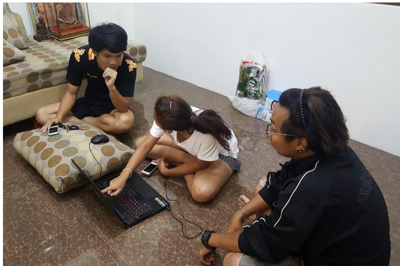
ภาพที่ 4.9 เช็ค Footage ทั้งหมด

เมื่อถ่ายทำเสร็จสิ้นแล้วก็ต้องตรวจสอบความเรียบร้อยของ Footage ให้เรียบร้อย เพื่อที่จะดำเนินการส่งไปในกระบวนการ Post-Production ต่อไป