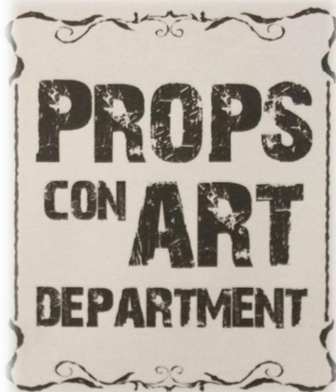
รูปที่ 3.1 โลโก้หัวกระดาษของห้างหุ้นส่วนจำกัด พร็อพส์ คอน อาร์ต ดีพาร์ตเมนต์