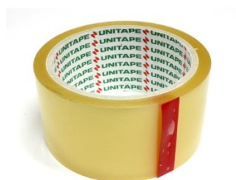
รูปที่ 3.7 เทปกาวใส