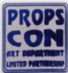
รูปที่ 3.2 โลโก้ตราปั๊มของห้างหุ้นส่วนจำกัด พร็อพส์ คอน อาร์ต ดีพาร์ตเมนต์