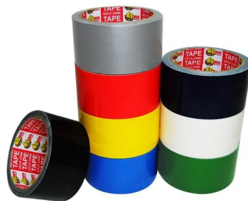
รูปที่ 3.8 เทปกาวหนังไก่