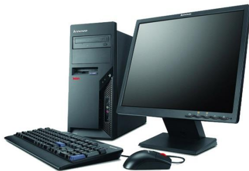
รูปที่ 3.14 คอมพิวเตอร์