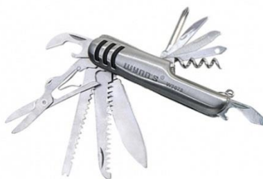
รูปที่ 3.13 มีดเอกประสงค์