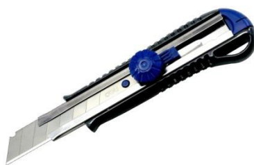
รูปที่ 3.6 คัตเตอร์