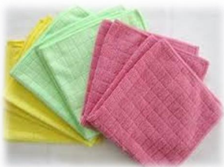
รูปที่ 3.10 ผ้าจี้ริ้ว