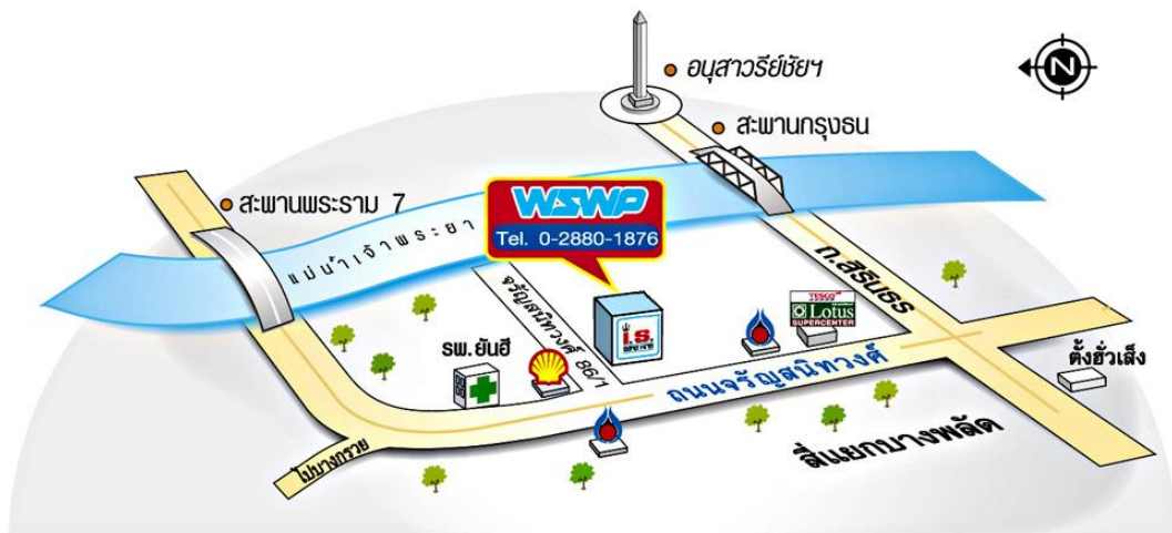
รูปที่ 3.2 แผนที่บริษัท วงศ์สว่างพับลิชชิ่ง แอนด์ พริ้นติ้ง จำกัด