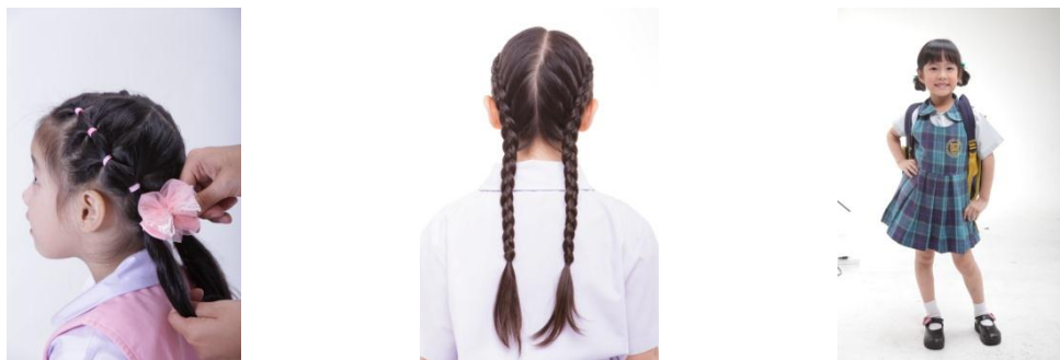
รูปที่ 3.9 ตัวอย่างผลงานด้านการถ่ายภาพ (Photo Shooting) ภายในสตูดิโอของบริษัท

บริการงานถ่ายภาพและสตูดิโอให้เช่าระดับมืออาชีพ ด้วยประสบการณ์ด้านสื่อสิ่งพิมพ์ที่ควบคู่ไปกับงานด้านการถ่ายภาพนี้มากกว่า 50 ปี เราจึงมีทีมงานคุณภาพจำนวนมาก ที่พร้อมให้บริการกับลูกค้าที่ต้องการงานถ่ายภาพในทุกสไตล์ โดยทีมกล้องระดับมืออาชีพ ประสบการณ์สูง รวมถึงทีมงานสไตลิสต์ (Stylist) และทีมงานช่างแต่งหน้า (Makeup) ระดับมืออาชีพ พร้อมอุปกรณ์คุณภาพสูงที่ทันสมัยและสตูดิโอขนาดใหญ่ได้มาตรฐาน รองรับทุกงานเท่าที่คุณต้องการ