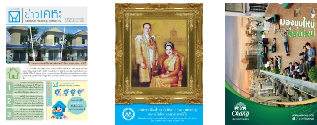
รูปที่ 3.8 ตัวอย่างผลงานด้านการพิมพ์ (Printing)

บริการออกแบบงานสื่อสิ่งพิมพ์ทุกชนิด ด้วยทีมงานออกแบบและทีมงานเทคนิคคุณภาพ ที่ใส่ใจในทุกรายละเอียดของการทำงาน