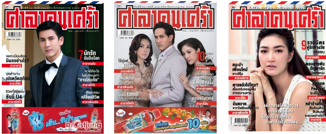
รูปที่ 3.5 ตัวอย่างนิตยสารศาลาคนเศร้ารูปโฉมใหม่

อย่างสูง โดยในปัจจุบันฉลองครบรอบ 50 ปี สำหรับพ็อคเก็ตบุ๊กที่เป็นตำนานของเมืองไทย ได้ปรับรูปโฉมใหม่เป็นนิตยสารที่มีรูปเล่มใหญ่ขึ้น ดูทันสมัยมากขึ้น และมีคอลัมน์ที่มีสาระเพิ่มขึ้นมากมาย นิตยสารศาลาคนเศร้าจะเป็นนิตยสารรายเดือน ที่มีกำหนดวางแผง ทุกวันที่ 1 ของทุกเดือน