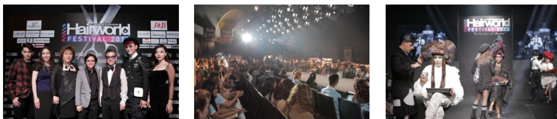
รูปที่ 3.10 ตัวอย่างผลงานด้านกิจกรรมพิเศษนอกสถานที่ (Event) จากงาน Hairworld Festival 2015 เมื่อวันที่ 28-30 กันยายน 2558 ณ ลานพาร์คพารากอน

ด้วยประสบการณ์ในการเป็นผู้จัดงานกิจกรรมพิเศษใหญ่ๆ ระดับประเทศมาแล้วมากมาย ทั้งระบบแสง สี เสียง แพงพั่ง งานโครงสร้างทุกระดับ ทีมประชาสัมพันธ์ พร้อมด้วยทีมออกแบบและทีมจัดงาน (Organize) คุณภาพ ที่ผ่านเวทีระดับประเทศมาแล้วมากมาย เราสามารถสร้างสรรค์งานทุกระดับได้ตามที่ลูกค้าต้องการ