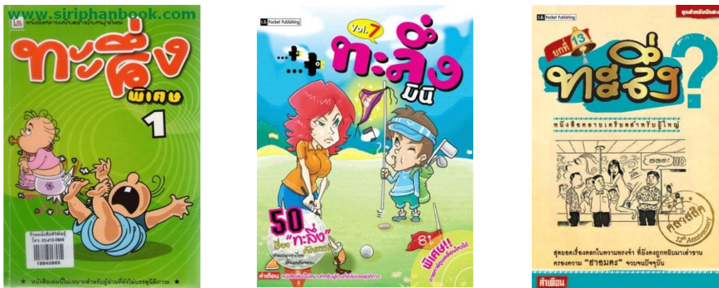
รูปที่ 3.7 ตัวอย่างหนังสือทะเลิ่ง

เข้าสู่ปี 2540 ได้พลิกผันวงการหนังสือด้วยการริเริ่มทำพ็อคเก็ตบุ๊กสำหรับผู้ใหญ่ชื่อ “ทะเลิ่ง” ซึ่งได้รับผลตอบรับอย่างท่วมท้น ดิ ด 1 ใน 10 หนังสือขายดีของร้านหนังสือชั้นนำ ติดต่อกันเป็นเวลานานหลายเดือน