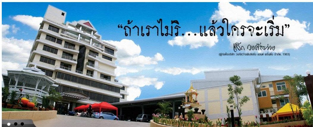
รูปที่ 3.3 บริษัท วงศ์สว่างพับลิชชิ่ง แอนด์ พรินติ้ง จำกัด