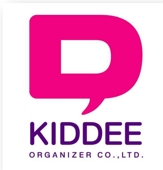
รูปที่ 3.1 ภาพตราสัญลักษณ์บริษัท คิคดี ออกาไนเซอร์ จำกัด

3.1.2 ที่ตั้งสถานประกอบการ : 38/1 ซอยเจริญนคร14 แขวงคลองตันใต้ เขตคลองสาน กรุงเทพมหานคร 10600 โทรศัพท์/แฟกซ์ 02 862-0947