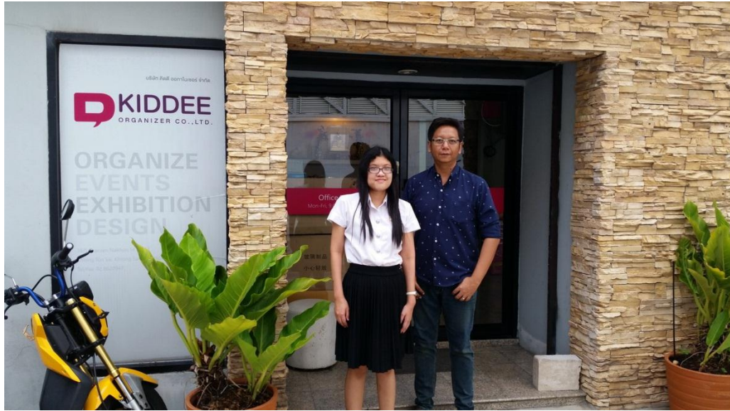
รูปที่ 3.2 ภาพสถานประกอบการบริษัท คิดดี ออกาไนเซอร์ จำกัด