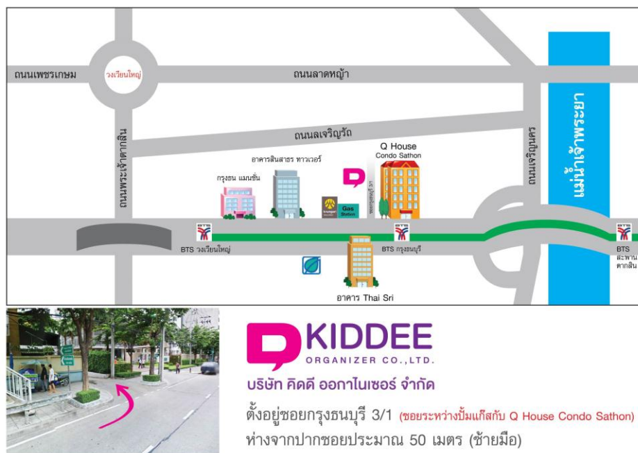
รูปที่ 3.3 แผนที่สถานประกอบการบริษัท คิดดี ออกาไนเซอร์ จำกัด