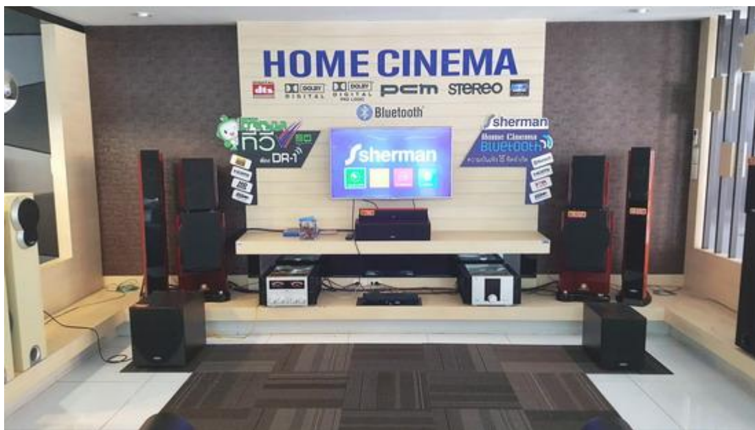
รูปที่ 3.4 เซ็ตโฮมเธียเตอร์ตัวอย่างภายในบริษัท