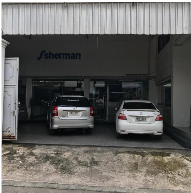
รูปที่ 3.3 บริษัท นิคอนไทย เซลส์แอนด์เซอร์วิส จำกัด