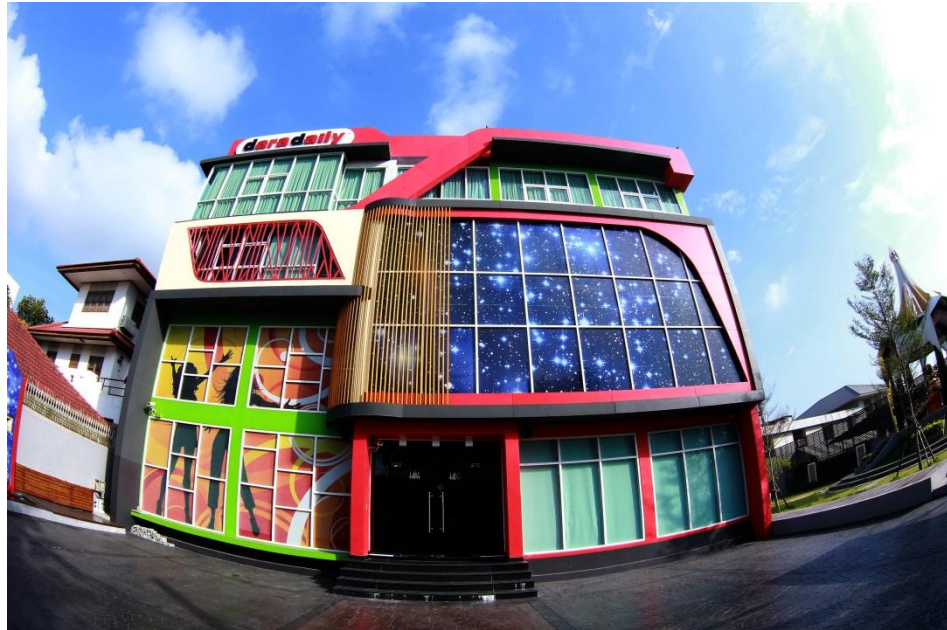
รูปที่ 3.2 สถานที่ตั้งบริษัท ดาราเดลี จำกัด