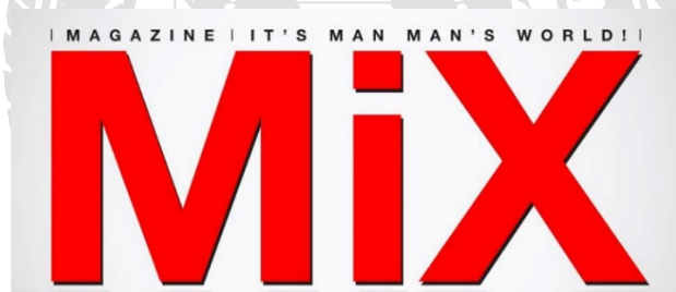
ภาพประกอบที่ 3.1 ตราสัญลักษณ์ บริษัท มิตรมาया จำกัด

Facebook : facebook.com/MiXMagazineThailand