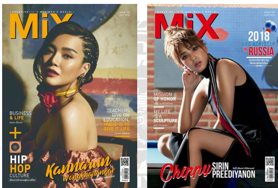
ภาพประกอบที่ 3.3 ตัวอย่าง MiX Magazine

ธุรกิจหลักคือ เป็นผู้จัดทำ MiX Magazine นิตยสารวาไรตี้สำหรับสุภาพบุรุษ โดยครอบคลุมทั้ง ในส่วนของแฟชั่น และเนื้อหาหลากหลาย ไม่ว่าจะเป็น กิน ดื่ม เที่ยว อัปเดตเรื่องราวต่างๆ ที่น่าสนใจในปัจจุบันและเป็นช่องทางในการโฆษณาสินค้าและบริการ