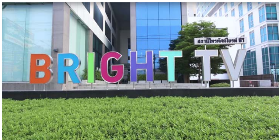
ภาพประกอบที่ 3.4 ภาพถ่ายด้านหน้าหน้าตึกสถานี บริษัท ไบรท์ทีวี จำกัด