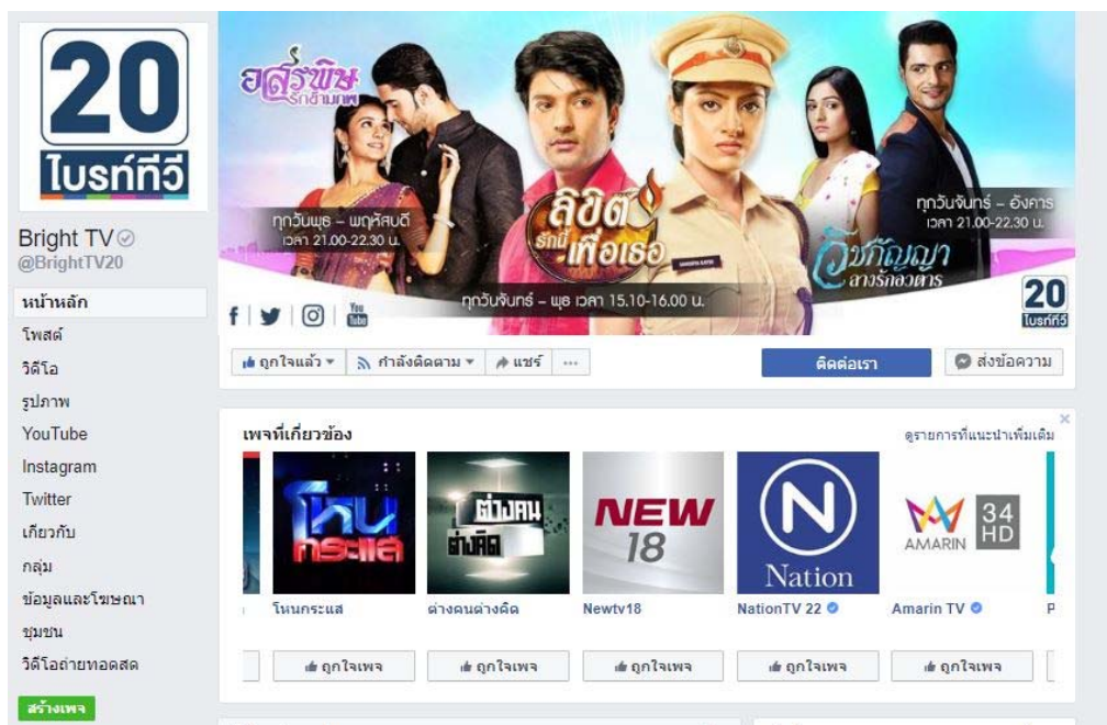
ภาพประกอบที่ 3.6 ช่องทางการติดต่อผ่านแฟนเพจFacebook