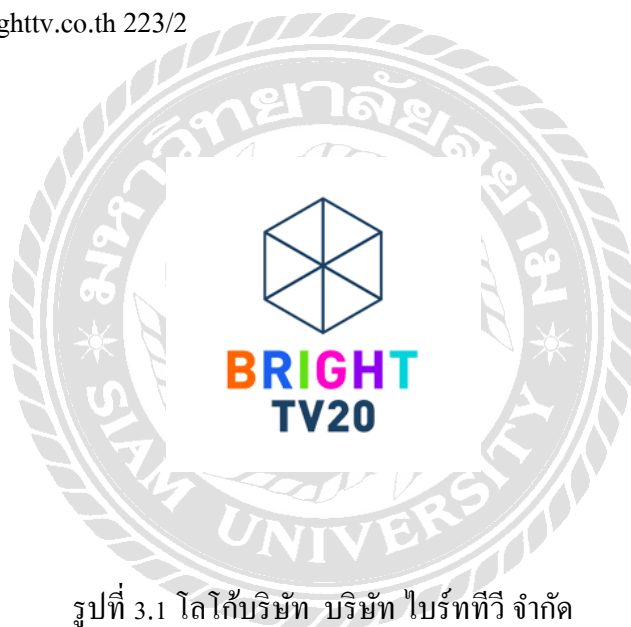
รูปที่ 3.1 โลโก้บริษัท บริษัท ไบรท์ทีวี จำกัด