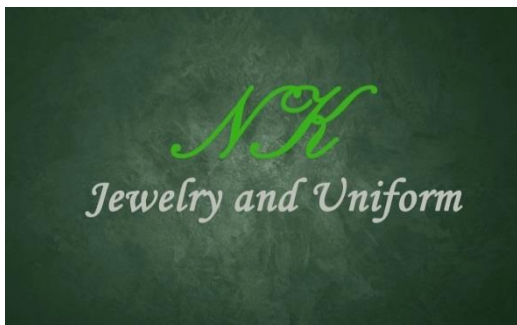
รูปที่ 3.1 Logo ของบริษัทนาฬิกาจิวเวลรี่ แอนด์ ยูนิฟอร์ม

ชื่อสถานประกอบการ : บริษัทนาฬิกาจิวเวลรี่ แอนด์ ยูนิฟอร์ม