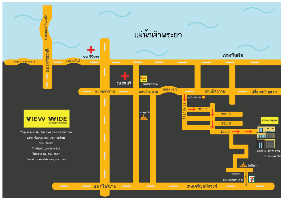
รูปที่ 3.2 แผนที่ บริษัท วิวไซด์ จำกัด