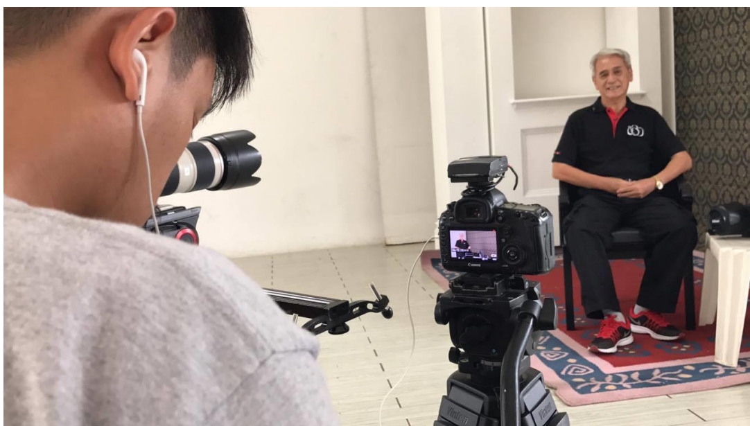
รูปที่ 3.3 การให้บริการหลักขององค์กร

ตั้งแต่ก่อตั้งบริษัท วิวไวด์ จำกัด ได้รับความไว้วางใจและความเชื่อมั่นจากกลุ่มธุรกิจต่างๆไม่ว่าจะเป็นกลุ่มอุตสาหกรรม กลุ่มเกษตรกรรม กลุ่มพลังงาน รวมถึงบริษัทรายย่อยต่างๆทำให้บริษัทได้เป็นผู้ผลิตสื่อภาพเคลื่อนไหวที่หลากหลายจากทั้งภาครัฐและภาคเอกชน