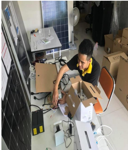
รูปที่ ก.4 ตรวจสอบเครื่องกระจายสัญญาณ