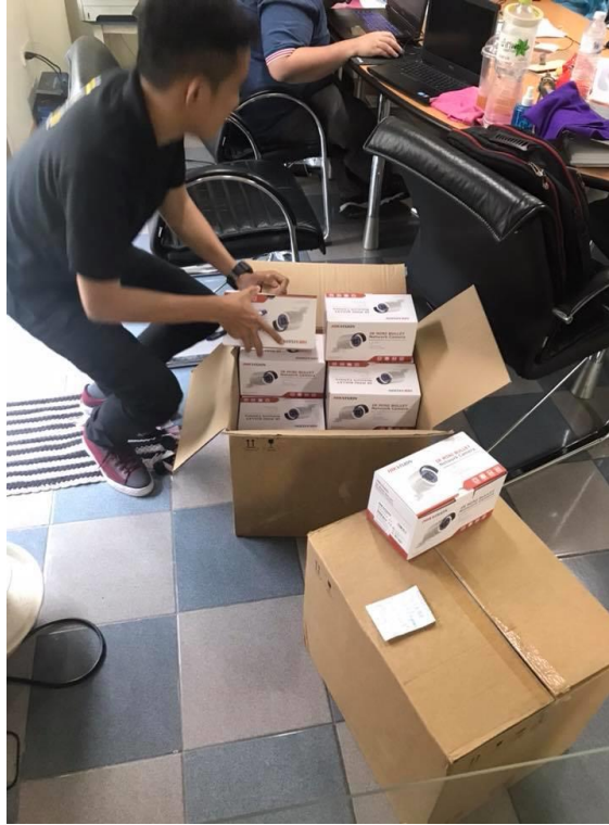
รูปที่ ก.3 ตรวจสอบกล่องที่จะนำไปติดตั้งให้ลูกค้า