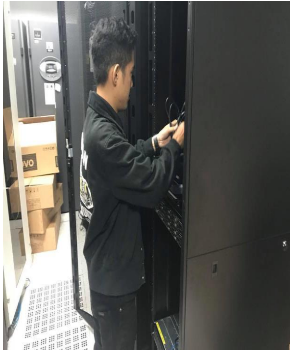
รูปที่ ก.5 ติดตั้งระบบและนำปัญหามาปรับปรุงแก้ไข