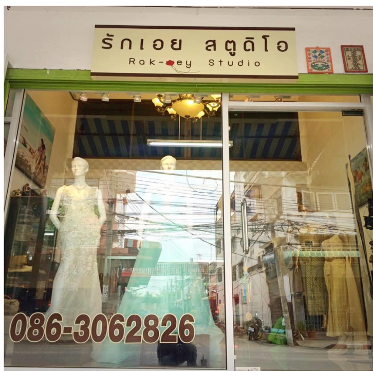
รูปที่ 3.1. รูปหน้าร้าน รักเอยสตูดิโอ

Fanpage: รักเอยสตูดิโอ-หน้าปากซอยก้านน้มน้มน 15