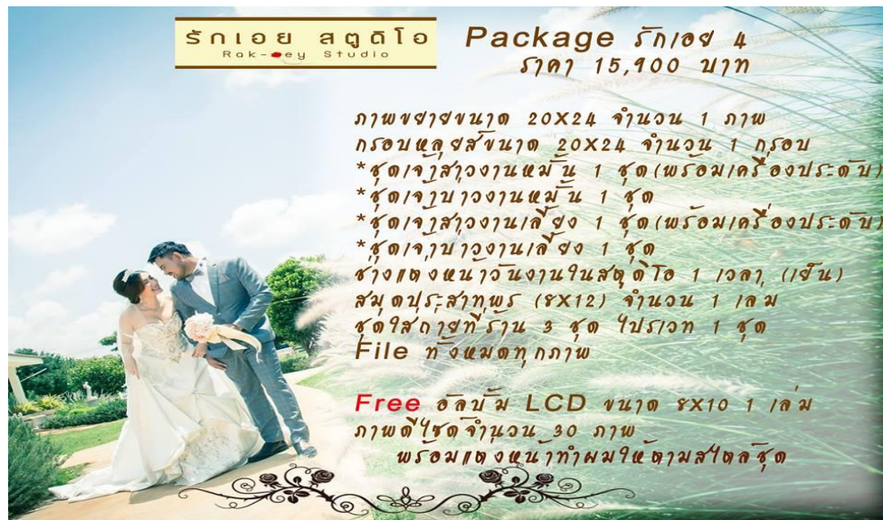
รูปที่ 3.6. Package ของทางร้าน 4