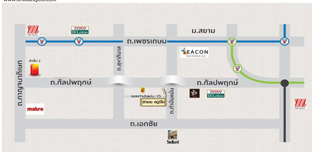
รูปที่ 3.2. แผนที่ของร้านรักเอยสตูดิโอ

รักเอย สตูดิโอ ( หน้าปากซอยกำนันเม่น 15 ) 90/12 หมู่ 3 ถนนกำนันเม่น แขวงบางขุนเทียน เขตจอมทอง กรุงเทพฯ 10150 โทรศัพท์ : 086-3062826 , 081-6945434 , 081-4222292 Facebook : รักเอยสตูดิโอ Fanpage : รักเอยสตูดิโอ-หน้าปากซอยกำนันเม่น15 www.รักเอยสตูดิโอ.com