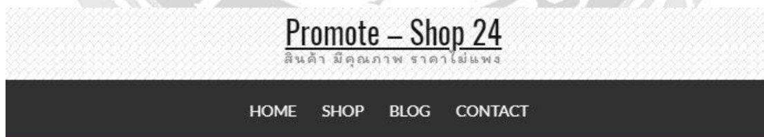
รูปที่ 4.3 แสดงหน้าเมนู