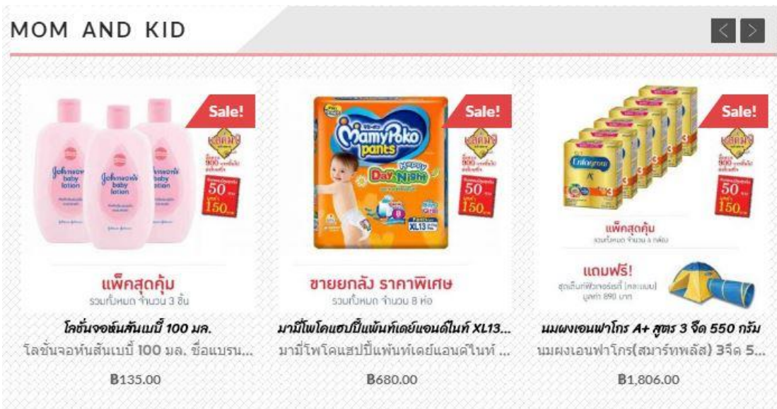
รูปที่ 4.4 หน้าหมวดสินค้า Mom and kid จากรูปที่ 4.4 แสดงหน้าหมวดสินค้า Mom and kid ประกอบด้วยสินค้า เช่น ผ้าอ้อมเด็ก และ นมผง เป็นต้น