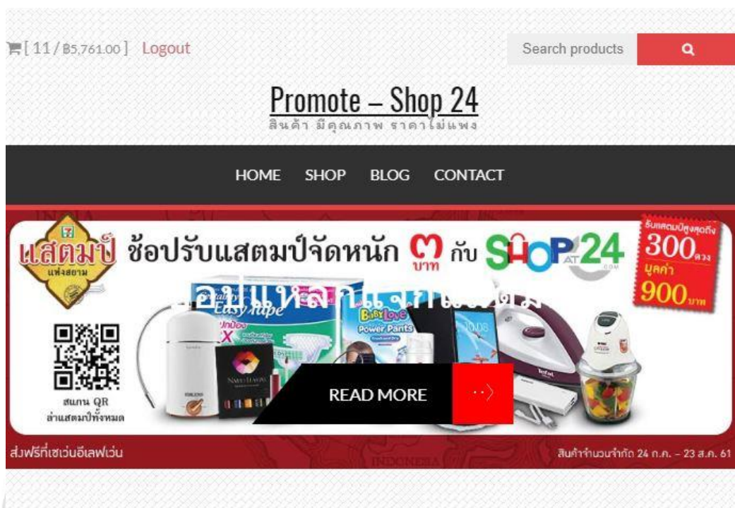
รูปที่ 4.2 หน้าหลักของเว็บไซต์

จากรูปที่ 4.1 แสดงหน้าหลักของเว็บไซต์ ซึ่งประกอบไปด้วย