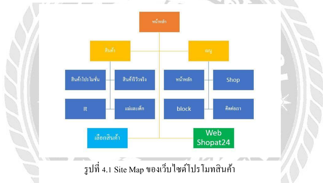
รูปที่ 4.1 Site Map ของเว็บไซต์โปรโมทสินค้า

การพัฒนาเว็บไซต์โปรโมทสินค้า เป็นการนำข้อมูลสินค้าที่จะโปรโมทโชว์ข้อมูลบนหน้าเว็บไซต์ เพื่อช่วยให้ลูกค้าสนใจสินค้ามากขึ้นและโน้มน้าวให้ลูกค้าตัดสินใจซื้อสินค้าเพิ่มมากขึ้น โดยเว็บไซต์โปรโมทสินค้าสร้างขึ้นเพื่อเพิ่มความสะดวกให้ลูกค้า ช่วยดึงดูดลูกค้าทำให้ลูกค้าสนใจมากขึ้น โดยมีหน้าที่ดังนี้ ระบบจะทำหน้าที่โชว์สินค้าที่ต้องการโปรโมท ผ่านหน้าเว็บโดยไม่ต้องเข้าหน้าเว็บ shopat24.com มีการใช้โปรแกรม Wordpress, Xampp, Photoshop, Browser Google Chrome , Firefox โดยใช้ภาษา HTML