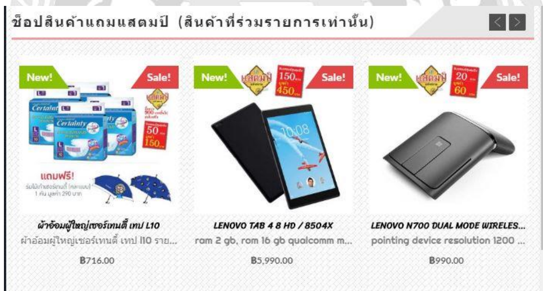
รูปที่ 4.5 หน้าหมวด It จากรูปที่ 4.5 แสดงหน้าหมวดสินค้า It ประกอบด้วยสินค้า เช่น นาฬิกาเพื่อสุขภาพ และ โทรศัพท์ และ สินค้าแถมแถมปี