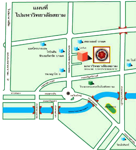
รูปภาพที่ 3.3 แผนที่มหาวิทยาลัยสยาม