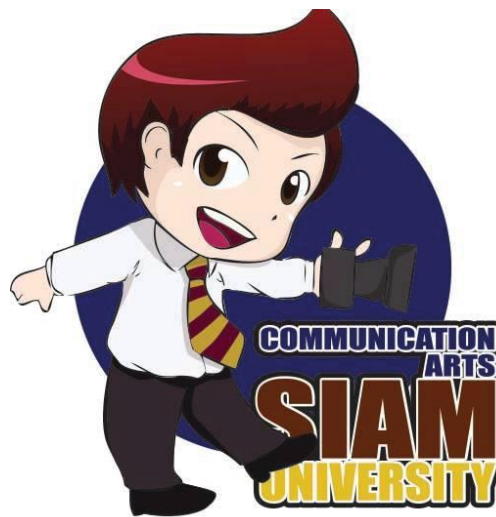
รูปภาพที่ 3.2 ตราสัญลักษณ์คณะนิเทศศาสตร์