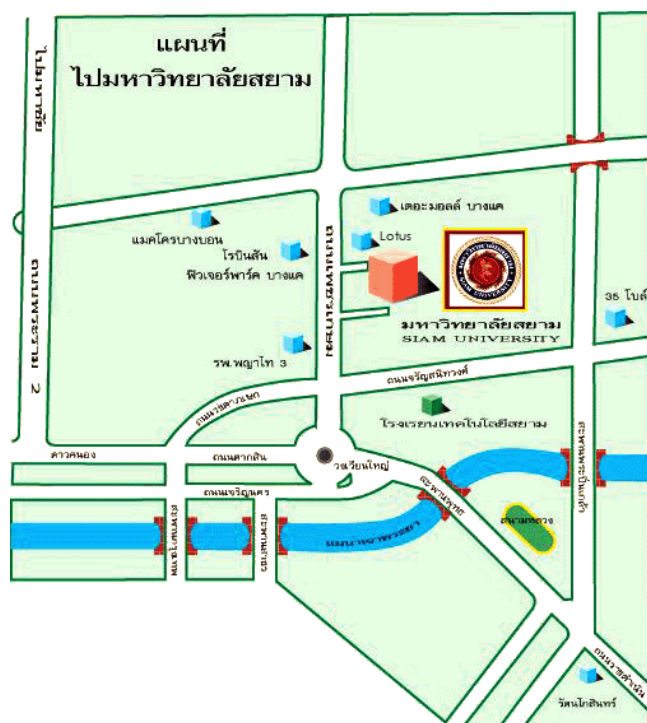
รูปภาพที่ 3.3 แผนที่มหาวิทยาลัยสยาม