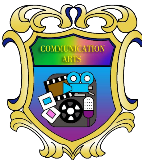
รูปภาพที่ 3.1 ตราสัญลักษณ์คณะนิเทศศาสตร์

เลขที่ 38 ถนนเพชรเกษม เขตภาษีเจริญ กรุงเทพมหานคร 10160