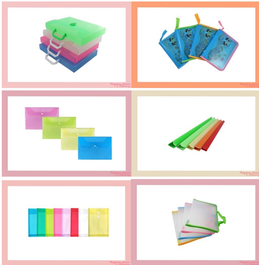
รูปที่ 3.3 ตัวอย่างผลงาน ของบริษัท เสง เสง โพรเกรส โพลีเมอร์ กรุ๊ป จำกัด

ผลิตพลาสติกที่เกี่ยวกับอุปกรณ์การศึกษาทุกชนิด สกรีนสีและพิมพ์ทองตามคำสั่งของลูกค้า