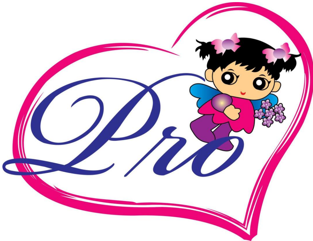
รูปที่ 3.1 โลโก้บริษัท เสง เสง โพรเกรส โพลีเมอร์ กรุ๊ป จำกัด

Facebook:บริษัท เสง เสง โพรเกรส โพลีเมอร์ กรุ๊ป จำกัด -รับผลิตจัดจำหน่ายพลาสติก