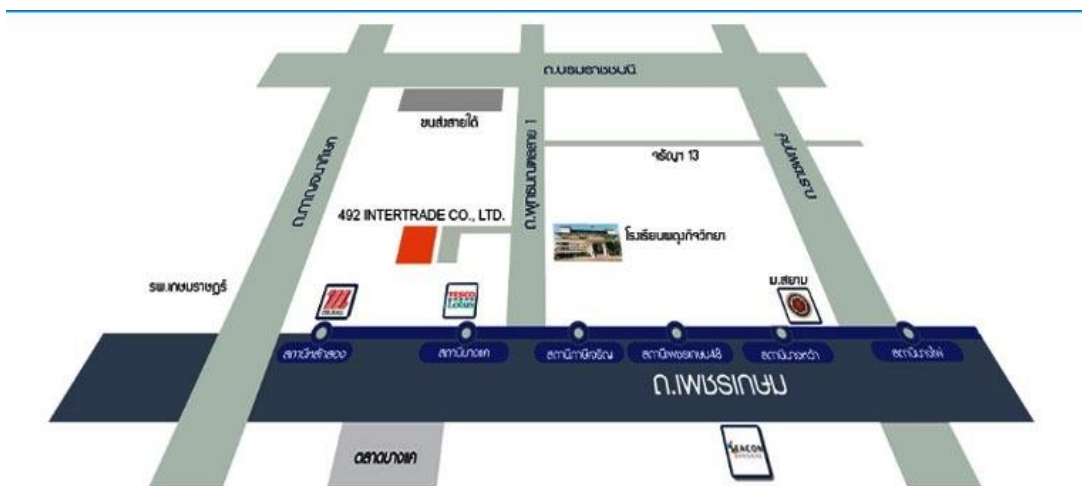
รูปที่ 3.2 แผนที่บริษัท 492 อินเตอร์เทรด จำกัด