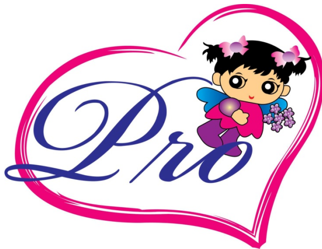
รูปที่ 3.1 โลโก้บริษัท เสง เสง โพรเกรส โพลีเมอร์ กรุ๊ป จำกัด

Facebook:บริษัท เสง เสง โพรเกรส โพลีเมอร์ กรุ๊ป จำกัด -รับผลิตจัดจำหน่ายพลาสติก