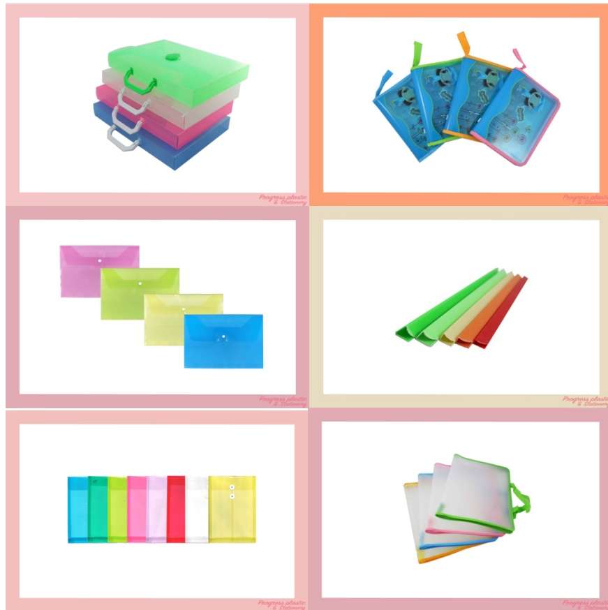
รูปที่ 3.3 ตัวอย่างผลงาน ของบริษัท เสง เสง โปรเกรส โพลีเมอร์ กรุ๊ป จำกัด

ผลิตพลาสติกที่เกี่ยวกับอุปกรณ์การศึกษาทุกชนิด สกรีนสีและพิมพ์ทองตามคำสั่งของลูกค้า