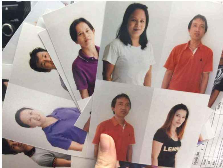
เตรียมอุปกรณ์การจัดบอร์ด