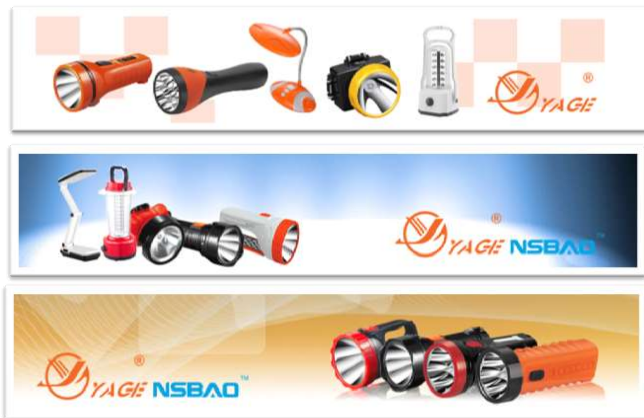
รูปที่ 3.4 ตัวอย่าง สินค้าที่บริษัท492Intertrade .,CO.LTD

เพื่อที่จะสร้างแบรนด์ให้มีชื่อเสียง จึงรับเชิญดาราชื่อดังในประเทศจีน ในนาม "คุณต้าปิง" เป็นพรีเซนเตอร์ของบริษัทในขณะที่เดียวกันเราได้รับความร่วมมือกับ "CCTV" "หูหนานทีวี" เป็นพันธมิตรทางธุรกิจที่มีการทำโปรโมตแบรนด์ของเราให้มีชื่อเสียงที่สุดในประเทศภายในประเทศและทั่วโลกปัจจุบัน Taigeer ได้กลายเป็นผู้นำตลาดด้าน "อุตสาหกรรม LED" ทำให้เราตระหนักถึงคุณค่าของความสำเร็จ เรายังยืนหยัดในการทำตลาดและจะสร้างสรรค์นวัตกรรมใหม่ ผลิตภัณฑ์และเทคโนโลยี ที่มีเทคโนโลยีขั้นสูงจากต่างประเทศ.