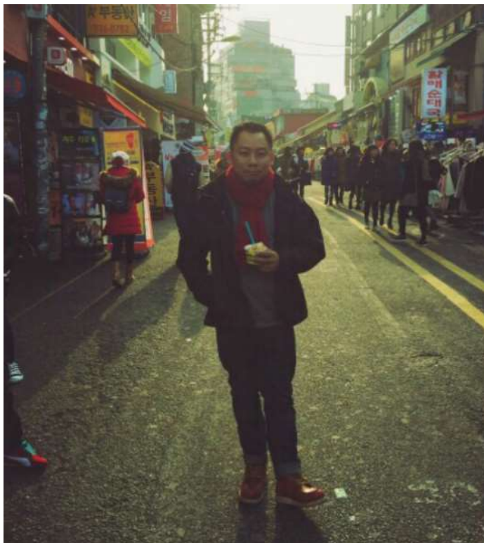
รูปที่ 3.6 พนักงานที่ปรึกษา

3.5.2 ตำแหน่งงานของพนักงานที่ปรึกษา เจ้าหน้าที่ฝ่ายการสื่อสารตลาด