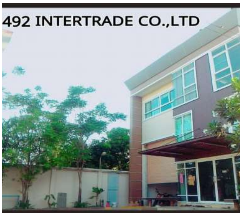
รูปที่ 3.3 บริษัทที่ปฏิบัติงานสหกิจศึกษา 492 Intertrade.,CO.LTD