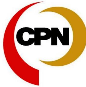
ภาพที่ 3.1. โลโก้ บริษัท เซ็นทรัลพัฒนา จำกัด (มหาชน)

7/222 ถ.บรมราชชนนี แขวงอรุณอมรินทร์ เขตบางกอก น้อย, 10700 Tel. 028-775-000