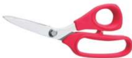
รูปที่ 3.10 กรรไกร