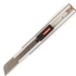
รูปที่ 3.4 คัตเตอร์