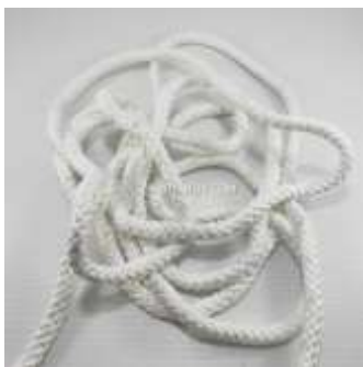
รูปที่ 3.11 เชือกมัดอุปกรณ์ไว้ข้างตัว