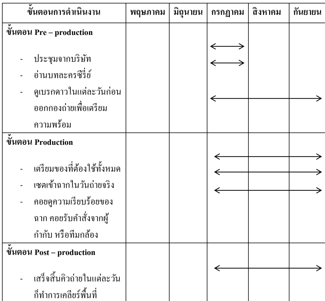
ตารางที่ 3.1 ตารางแสดงระยะเวลาในการดำเนินงาน ละครซีรี่ส์ “The Cupids”