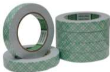
รูปที่ 3.8 กาวสองหน้าโฟม