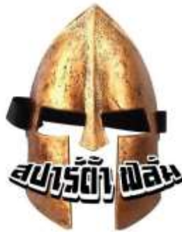
รูปที่ 3.1 โลโก้ของบริษัท สปาร์ต้า ฟิล์ม จำกัด

3.1.2 ที่ตั้งสถานที่ประกอบการ หมู่ที่615/61 ซอยชินเขต1/33 ถนนงามวงศ์วาน ท้องสองห้อง เขตหลักสี่ กรุงเทพฯ 10210