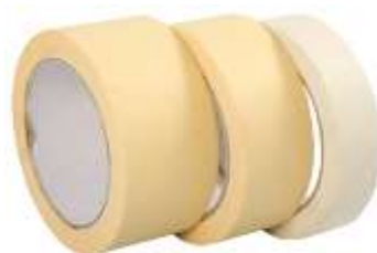
รูปที่ 3.6 เทปกาวหนังไก่