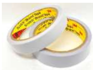
รูปที่ 3.7 กาวสองหน้า