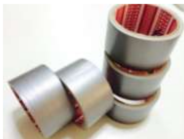
รูปที่ 3.9 เทปผ้าแลกซัน