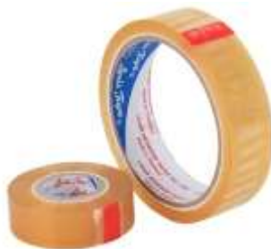
รูปที่ 3.5 สก๊อตเทปใส