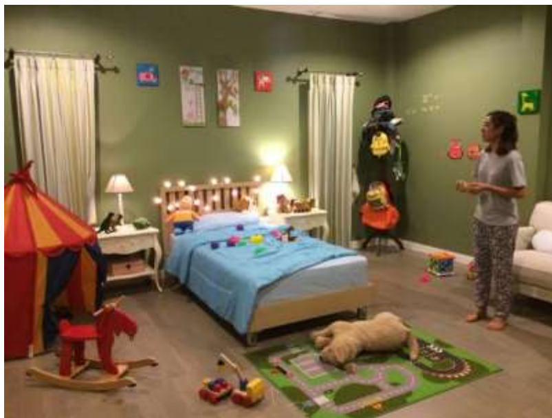
รูปที่ 4.7 เซ็ตฉากห้องนอนเด็ก

โดยการนำของเล่นเด็กตุ๊กตามาวางไว้ในจุดที่ได้ bocking ไว้เนื่องจากห้องนอนเด็กมีขนาดใหญ่ จึงสามารถนำของเล่นตุ๊กตาทั้งหมดมาวางไว้ได้ จึงได้มีการถ่ายทำห้องนอนเด็กหลายมุม