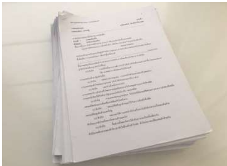
รูปที่ 4.1 บทละครซีรีส์เรื่อง “The Cupids”

บทละครซีรีส์ เรื่อง “The Cupids” ศึกษาอ่านบทละครซีรีส์ในแต่ละซีนว่าต้องใช้อุปกรณ์อะไรบ้างในการทำงาน ในแต่ละฉากอุปกรณ์นั้นก็จะใช้ไม่เหมือนกัน ก่อนที่เราจะหาอุปกรณ์มาทำนั้น เราต้องดูบท หรือคอย รับคำสั่งจากผู้กำกับว่าต้องใช้อะไรบ้างเพื่อความง่ายต่อการทำงาน