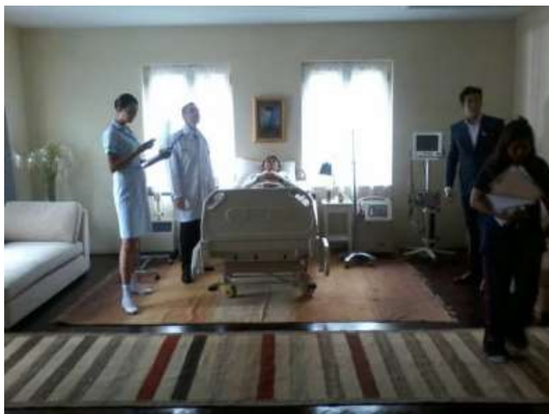
รูปที่ 4.8 เซ็ตฉากห้องโรงพยาบาลที่ต่างประเทศ

โดยการนำของเล่นเด็กตุ๊กตามาวางไว้ในจุดที่ได้ bocking ไว้เนื่องจากห้องนอนเด็กมีขนาดใหญ่ จึงสามารถนำของเล่นตุ๊กตาทั้งหมดมาวางไว้ได้ จึงได้มีการถ่ายทำห้องนอนเด็กหลายมุม