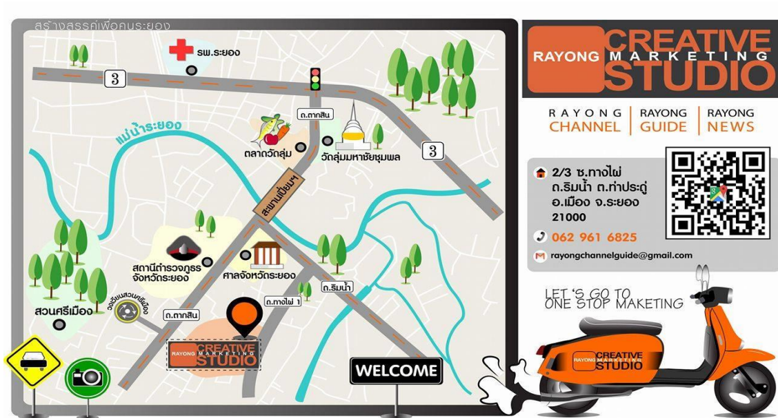
รูปที่ 3.1 แผนที่ของบริษัทระยองชาแนล

ชื่อสถานประกอบการ บริษัท RAYONGCHANNEL จำกัด ที่อยู่เลขที่ 2/3 ซอยทางไฟ 1 ตำบลท่าประดู่ อำเภอเมืองระยอง จังหวัดระยอง 21000 โทรศัพท์ 091-858-4702 , 084-779-9282