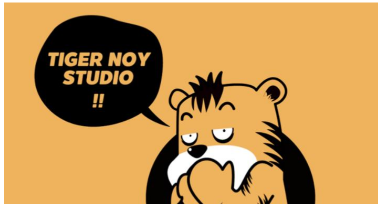
รูปที่ 3.1 ตราสัญลักษณ์ (Logo) ไทเกอร์น้อย สตูดิโอ