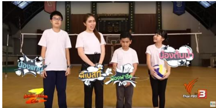
รูปที่ 3.2 รายการ Animation Club Z