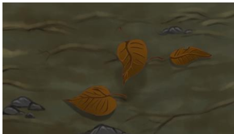
รูปที่ 3.4 โมชันกราฟิกออกอากาศทางสถานีโทรทัศน์ไทยพีบีเอส