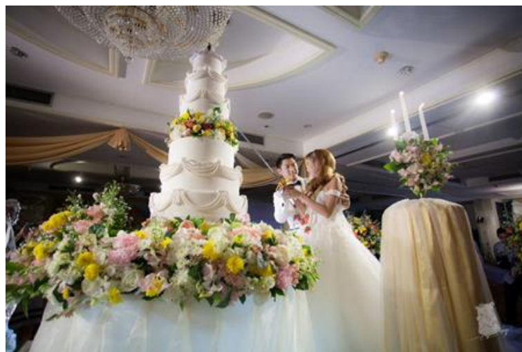
รูปที่ 3.3 ถ่ายภาพงานเลี้ยงฉลองพิธีมงคลสมรส