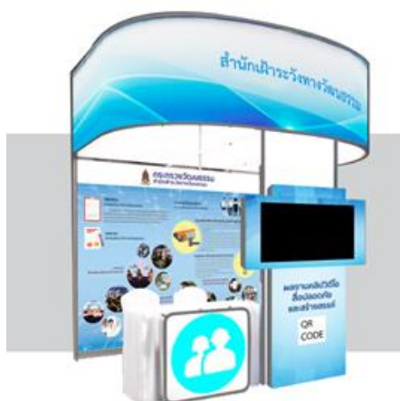
รูปที่ 3.6 บูชากิจกรรมและนิทรรศการ สำนักงานบริหารและพัฒนาองค์ความรู้ กระทรวงวัฒนธรรม งานรวมพลังสื่อสร้างสรรค์สังคมไทย ณ ศูนย์ประชุมวายุภักษ์ ศูนย์ราชการเฉลิมพระเกียรติ แจ้งวัฒนะ