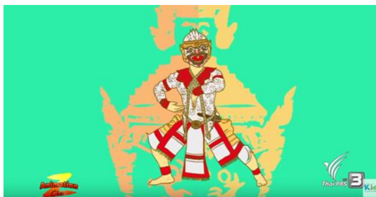
รูปที่ 3.5 ผลิตภัณฑ์อินโฟกราฟิก ออกอากาศทางสถานีโทรทัศน์ไทยพีบีเอส