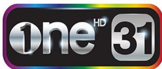
ภาพที่ 3.1.1 โลโก้ บริษัท เดอะ วัน เอ็นเตอร์ไพรส์ จำกัด

บริษัท เดอะ วัน เอ็นเตอร์ไพรส์ จำกัด เป็นบริษัทที่ดำเนินการผลิต ละคร เกมโชว์ วาไรตี้ และละครเวที เพื่อป้อนลงช่องต่างๆตลอดมา หลังจากก่อตั้ง เดอะ วัน เอ็นเตอร์ไพรส์ จำกัด นายถกลเกียรติ ได้รวม เอ็กแซ็กท์ และ ซิเนริโอ เข้ามาเป็นบริษัทเดียวกัน เพื่อความสะดวกในการบริหาร และภายหลัง จีเอ็มเอ็ม แกรมมี่ ได้รวมเอา บริษัท มิมิติ จำกัด เข้า เดอะ วัน เอ็นเตอร์ไพรส์ เพื่อร่วมผลิตเกมโชว์ลงช่องวันและจีเอ็มเอ็ม 25 และเพื่อเพิ่มความสะดวกในการบริหารให้เป็นหนึ่งเดียว