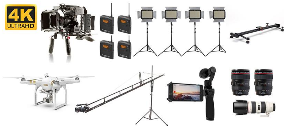
ภาพที่ 3.8.1 อุปกรณ์และเครื่องมือที่ใช้