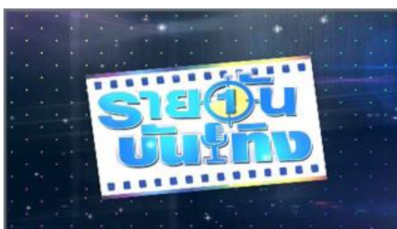
ภาพที่ 3.1.2 รายวันบันเทิง