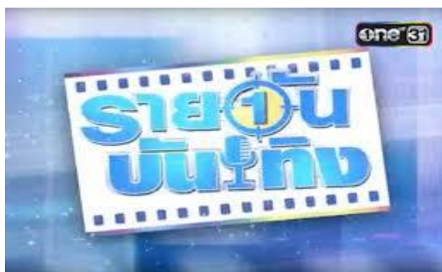
ภาพที่ 3.3 โลโก้รายการรายวัน บันเทิง

รูปแบบรายการ : รายวัน บันเทิง เป็นรายการข่าวบันเทิงที่มีโชว์ และพูดคุยในรายการกับแขกรับเชิญ ที่จะมาอัปเดตข่าวคราวและ ผลงานในวงการบันเทิง รายการรายวันบันเทิง ถ้าได้รู้แน่นอน ทุกวันจันทร์-ศุกร์ เวลา 11.30 น. - 12.00 น.