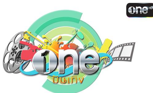
ภาพที่ 3.4 โลโก้รายการวันบันเทิง

รูปแบบรายการ : รายการวันบันเทิง เป็นรายการคุยข่าวบันเทิง กับ 2 พิธีกร ที่จะมาอัปเดตพูดคุยประเด็นข่าวฮอตในวงการบันเทิง ทุกวัน 17.00 น.