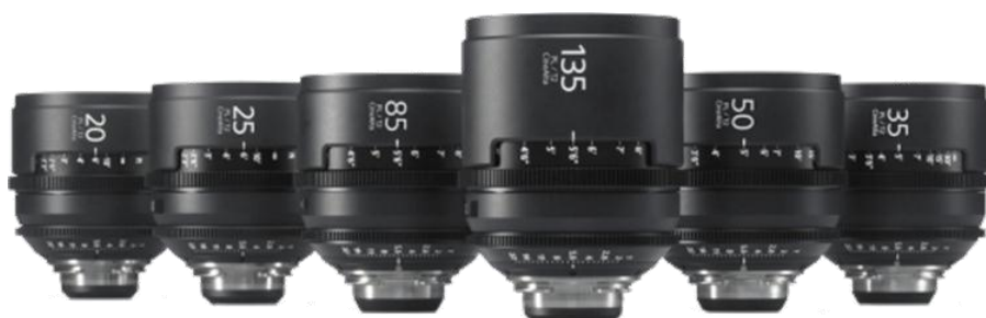
รูปที่3.4 เลนส์