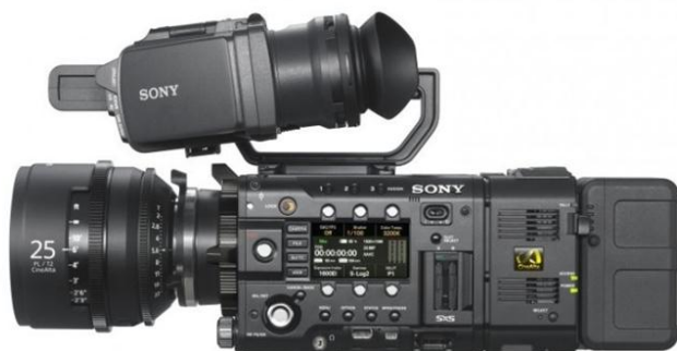
รูปที่3.3 กล้อง sony f5