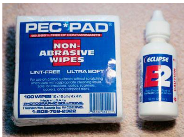
รูปที่ 4.4 กระดาษเช็ดเลนส์และน้ำยาเช็ดเลนส์

1.2.2. น้ำยาและกระดาษเช็ดเลนส์ ใช้ในกรณีที่มึคราบอยู่บนกระจกเลนส์