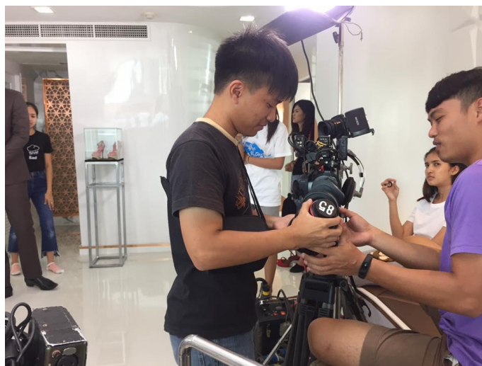
รูปที่ 4.8 เปลี่ยนเลนส์

เมื่อต้องการเปลี่ยนระะภาพในการถ่ายทำ ผู้ช่วยช่างภาพจะต้องเปลี่ยนเลนส์ตามที่ช่างภาพหรือผู้กำกับต้องการ