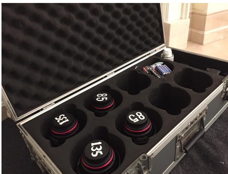
รูปที่ 4.7 เตรียมเลนส์

เตรียมเลนส์ที่ต้องใช้ในการถ่ายทำ เลนส์มีหลายช่วงหลายขนาดให้ความรู้สึกต่างกัน ในแต่ละเรื่องจะให้เลนส์หลายช่วงขนาดภาพแต่ละชิ้นจะไม่เหมือนกัน ผู้ช่วยช่างภาพจำเป็นต้องรู้เรื่องเลนส์ด้วยเพื่อให้การทำงานง่ายขึ้นเวลาช่างภาพบอกให้เปลี่ยนเลนส์