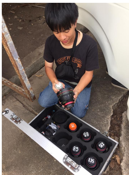
รูปที่ 4.3 ฉีดสเปรย์ลม

1.2.2. น้ำยาและกระดาษเช็ดเลนส์ ใช้ในกรณีที่มึคราบอยู่บนกระจกเลนส์