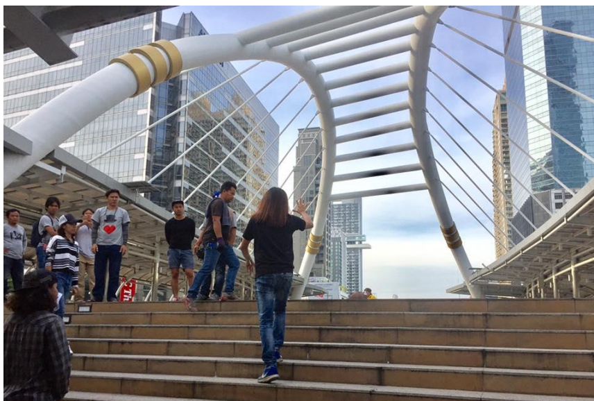
รูปที่ 4.5 จุดสถานที่ก่อนถ่ายทำ 1

การจุดสถานที่ในการถ่ายทำนั้น เป็นสิ่งสำคัญ เพื่อให้ช่างภาพ รู้ว่า ตำแหน่งของนักแสดงจะยืนอยู่ในตำแหน่งทิศทางใดจะต้องถ่ายตรงมุมไหนก่อนแล้วใช้เลนส์อะไรขึ้นอยู่ที่ช่างภาพจะได้บอกให้กับผู้ช่วยช่างภาพ อีกทีว่า ต้องเตรียมเลนส์อะไรบ้าง