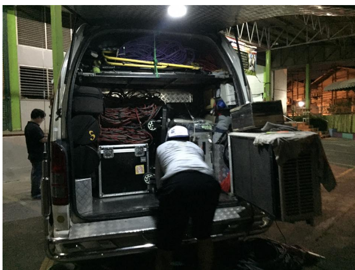
รูปที่ 4.10 เก็บอุปกรณ์