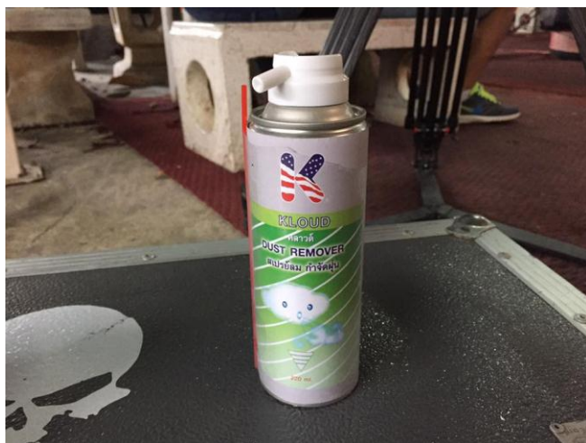
รูปที่ 4.2 สเปรย์ลม

1.2.1 สเปรย์ลม เป็นสเปรย์ลมความดันสูง เพื่อใช้ขจัดฝุ่นผงและสิ่งสกปรกในบริเวณที่ยากต่อการทำความสะอาด จะใช้กำจัดฝุ่นตามซอกหรือร่องต่างๆ ได้อย่างมีประสิทธิภาพ แล้วยังช่วยลดความเสียหายอันอาจเกิดจากการใช้น้ำทำความสะอาด