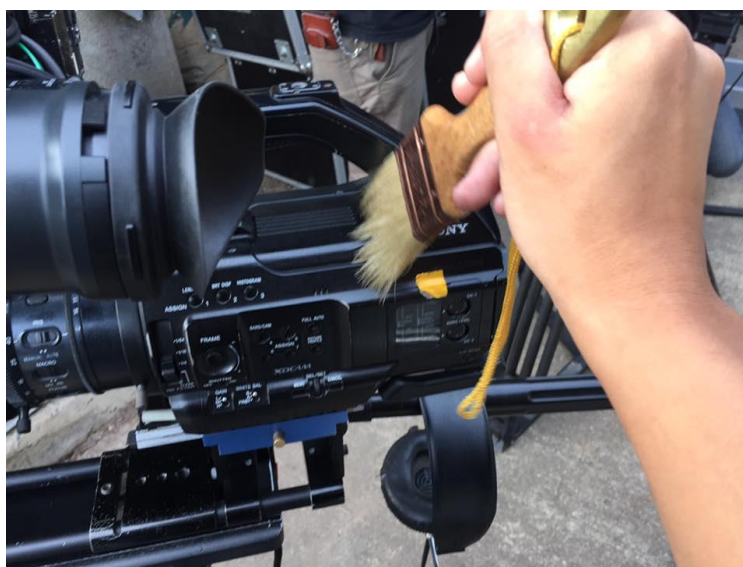
รูปที่ 4.1 แปรงขนอ่อน