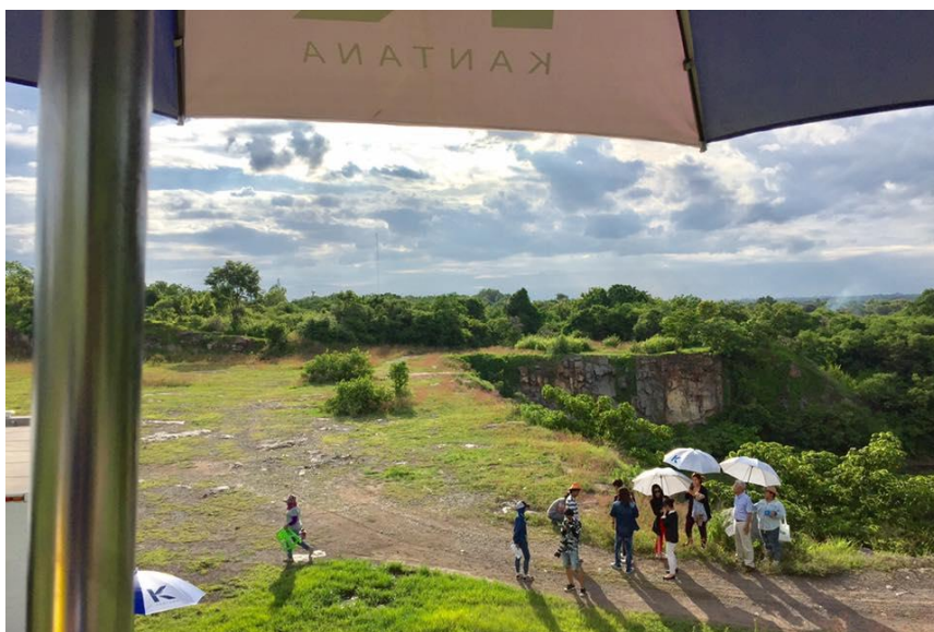
รูปที่ 4.6 จุดสถานที่ก่อนถ่ายทำ 2