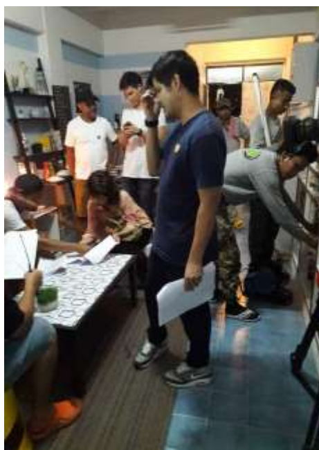
รูปที่ 4.2. เช็ทอุปกรณ์การถ่ายทำ และบล็อกกิ้งนักแสดง