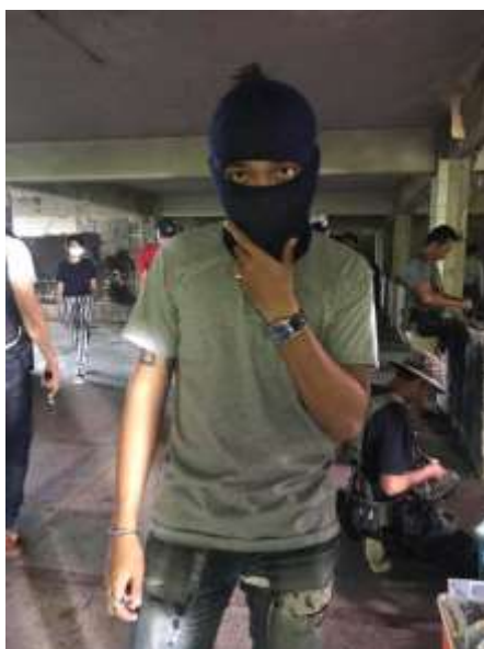
รูปที่ 4.3.1. เป็น Extra ละครเรื่องสารวัตรแม่ลูกอ่อน

4.3 สิ่งที่ทำนออกจากหน้าที่ที่ได้รับมอบหมาย ได้รับหน้าที่ให้เป็นนักแสดงประกอบในฉากบู๊ในละครเรื่องสารวัตรแม่ลูกอ่อน