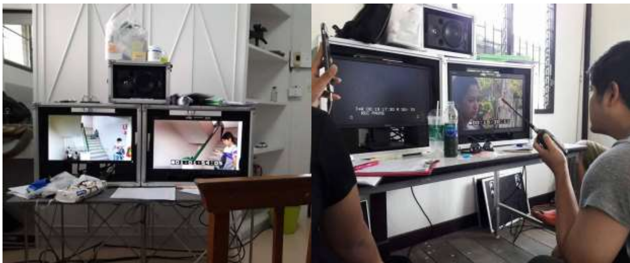
รูปที่4.2.4 หน้ามอนิเตอร์