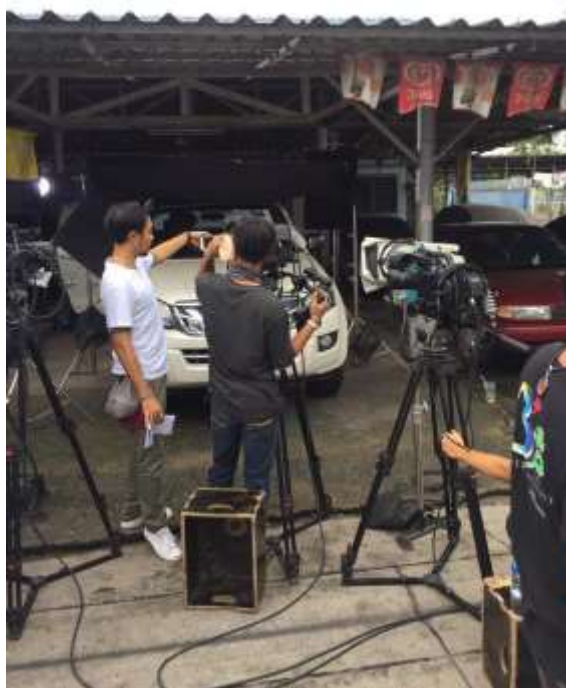
รูปที่ 4.2.2 เสรดละครเรื่องสารวัตรแม่ลูกอ่อน