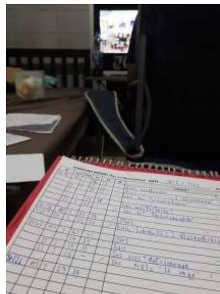
รูปที่4.2.5 จดรีพอร์ต