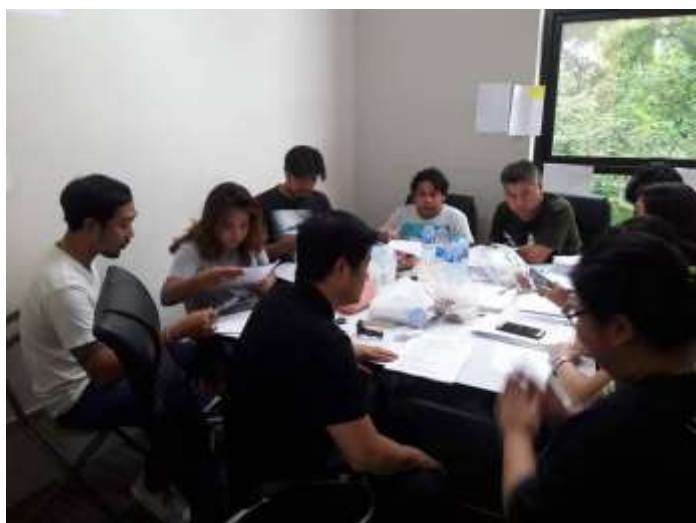
รูปที่ 4.1.1. ประชุมบท