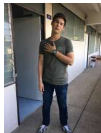
รูปที่ 4.2.3 ถ่ายรูปนักแสดงเพื่อดูความต่อเนื่องของเสื้อผ้า