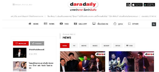
รูปที่ 3.4 เว็บไซต์ www.daradaily.com