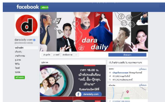
รูปที่ 3.5