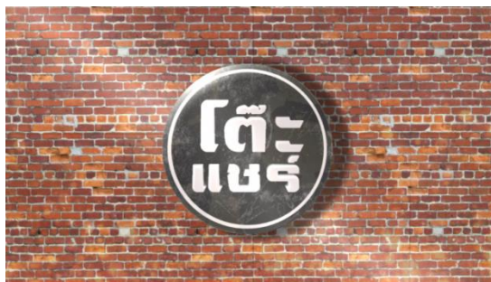
รูปที่ 3.6 Interlude รายการบันเทิงต่างๆ ของ DaraDaily