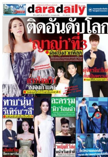
รูปที่ 3.7 หนังสือพิมพ์ DaraDaily