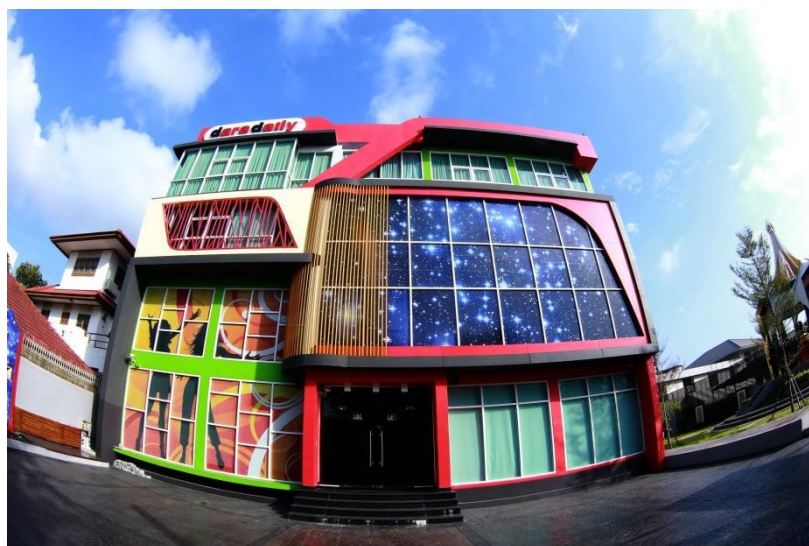
รูปที่ 3.2 ด้านหน้าบริษัท ดาราเดลี จำกัด