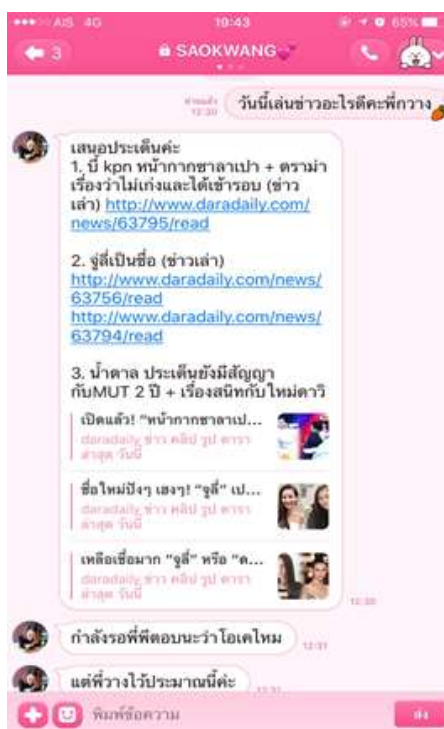
รูปที่ 4.3 ตัวอย่างการประสานงานกับฝ่ายโซเชียล

รายการ Daradai News เป็นรายการที่ฉายผ่านช่องทางแบบคู่ขนาน ซึ่งจะฉายทางเคเบิลทีวี และการไลฟ์สดผ่านทาง Facebook และ Youtube จึงต้องทำการประสานงานกับทางฝ่ายโซเชียลในการเลือกข่าวที่จะนำมาใช้ในรายการ ว่าใช้ประเด็นไหนข่าวไหนที่จะเหมาะสม ซึ่งจะสื่อสารกันผ่านทาง LINE ที่มีชื่อว่า SAOKWANG ของคุณ จิรวรรณ ไวกวิฑยะ ฝ่ายโซเชียล และ Donat_sarocha ของคุณ สโรชา จันทะมาต ฝ่าย Creative