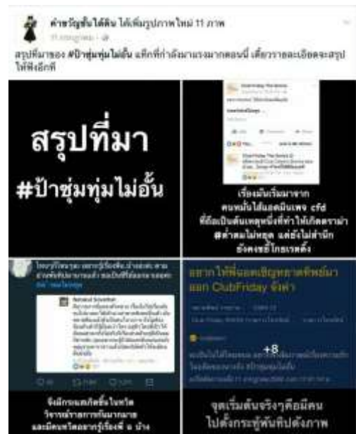
รูปที่ 4.4 ตัวอย่างการหาข้อมูลจากเพจ Facebook คำขวัญขึ้นได้คืน