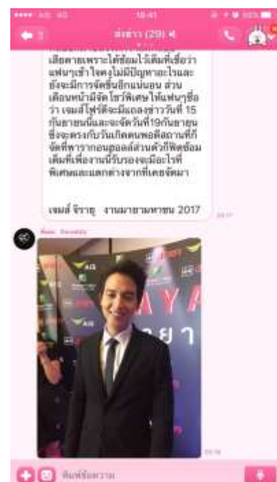
รูปที่ 4.2 ตัวอย่างการส่งข่าว