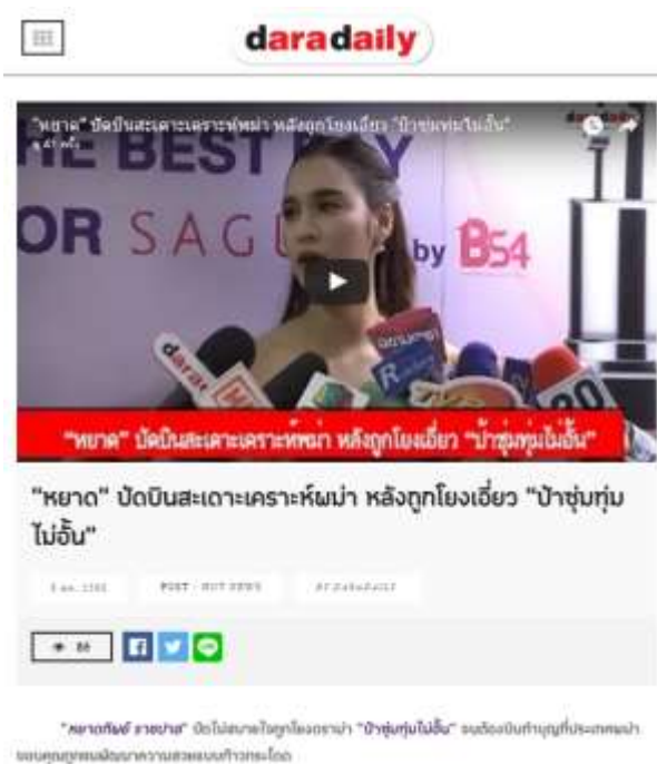
รูปที่ 4.5 ตัวอย่างการหาข้อมูลจากเว็บไซต์ Daradaily