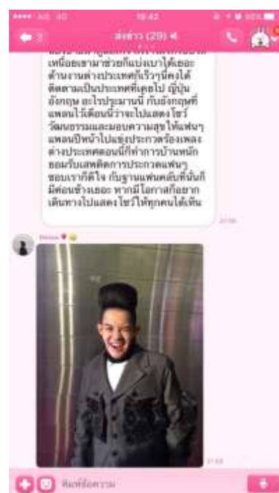
รูปที่ 4.1 ตัวอย่างการด่งข่า