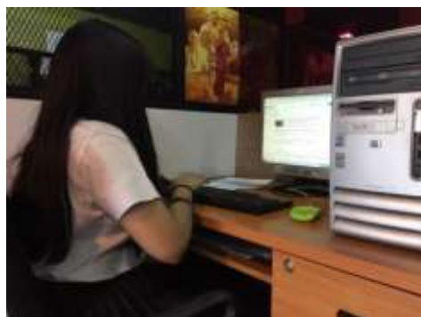
รูปที่ 4.6 ตัวอย่างการลงมือเขียนบทรายการโทรทัศน์