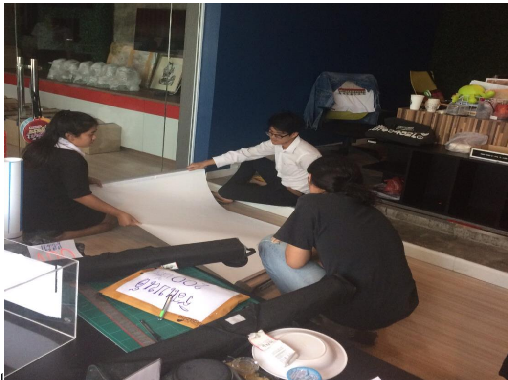
ขณะปฏิบัติการผลิตโรลอัพ