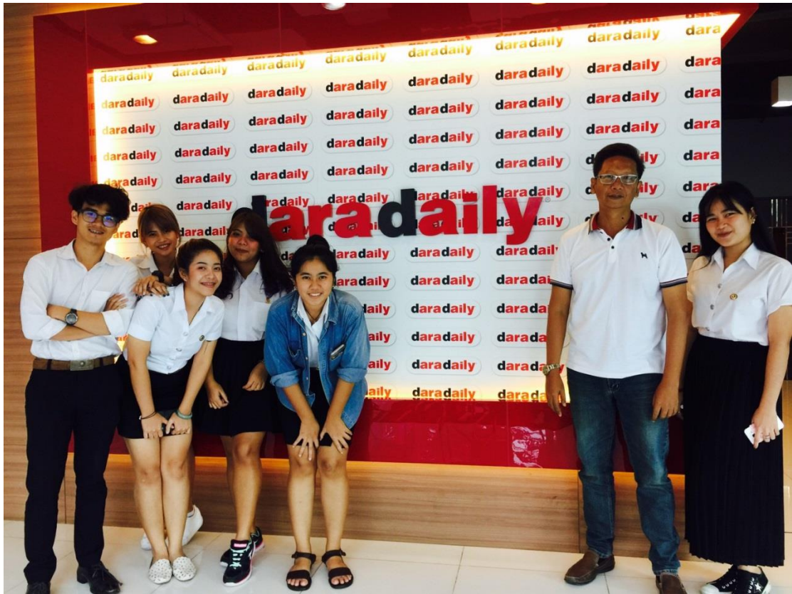
การนิเทศงานของอาจารย์ที่ปรึกษา