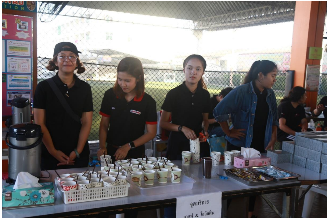
จัดเตรียมขนม – เครื่องดื่มให้ผู้ร่วมกิจกรรม