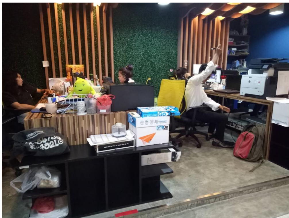
ขณะปฏิบัติงานภายในห้องแผนกกิจกรรมพิเศษ