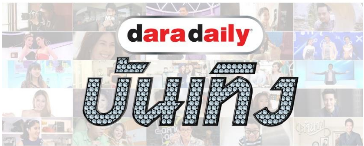
รูปที่ 3.6 ใต้ใต้รายการบันเทิงของดาราดaily