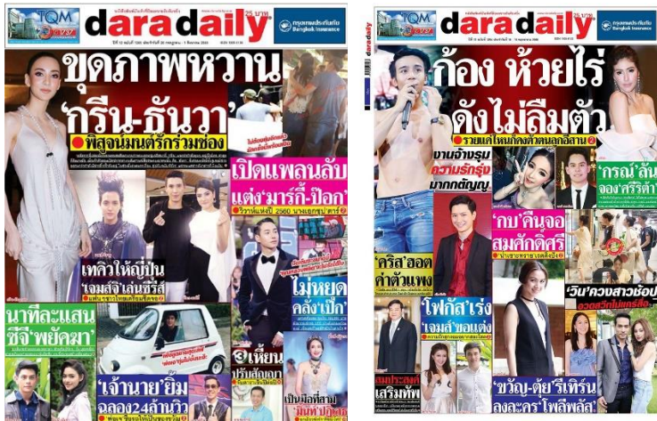
รูปที่ 3.5 หนังสือพิมพ์บันเทิงของบริษัทดาราดaily