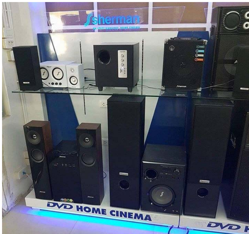
รูปที่ 3.5 สินค้าตั้งโชว์ในบริษัท คอนไทย เซลส์ แอนด์ เซอร์วิส จำกัด