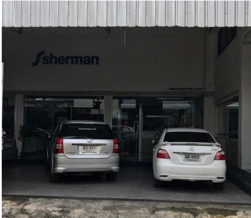
รูปที่ 3.4 รูปหน้าบริษัท คอนไทย เซลส์ แอนด์ เซอร์วิส จำกัด