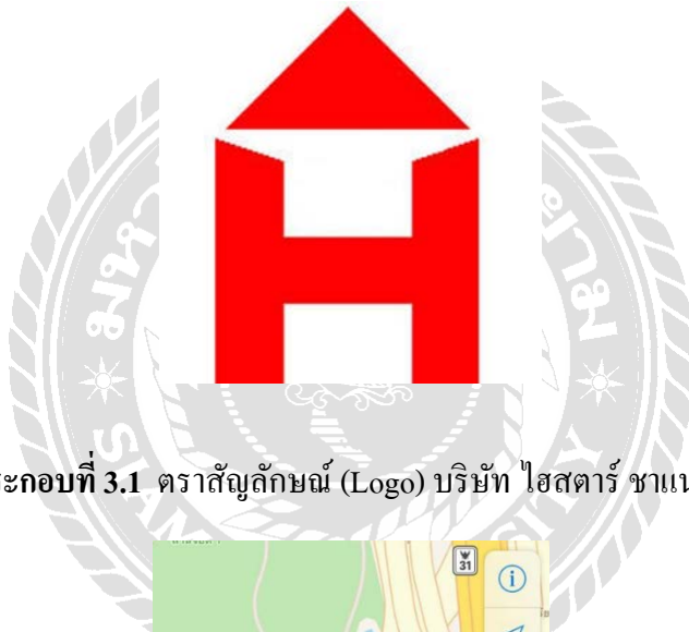
ภาพประกอบที่ 3.1 ตราสัญลักษณ์ (Logo) บริษัท ไฮสตาร์ ชาแนล จำกัด