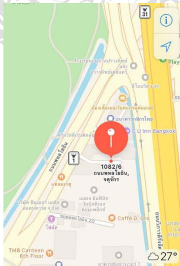
ภาพประกอบที่ 3.2 แผนที่บริษัท ไฮสตาร์ ชาแนล จำกัด