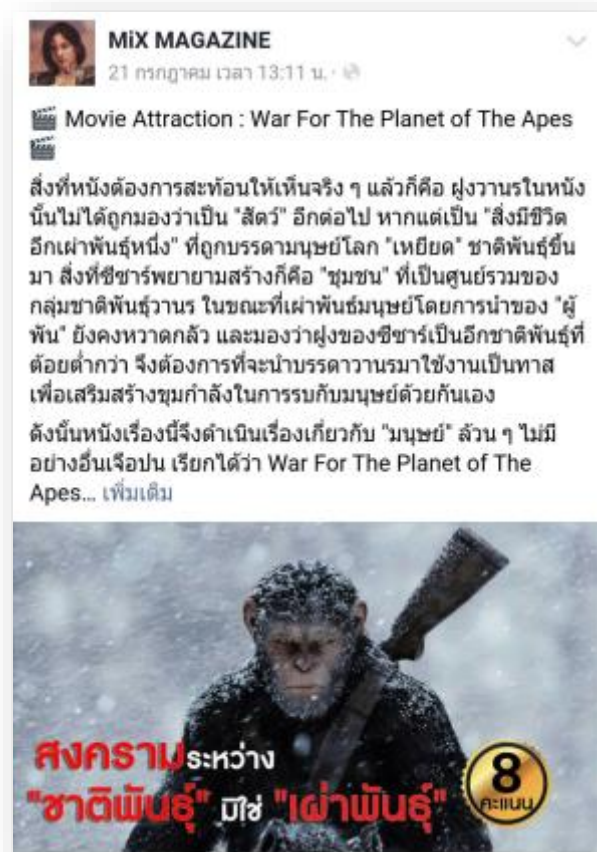
4.7 รูปตัวอย่างการโปรโมทภาพยนตร์โดยช่องทางแฟนเพจ