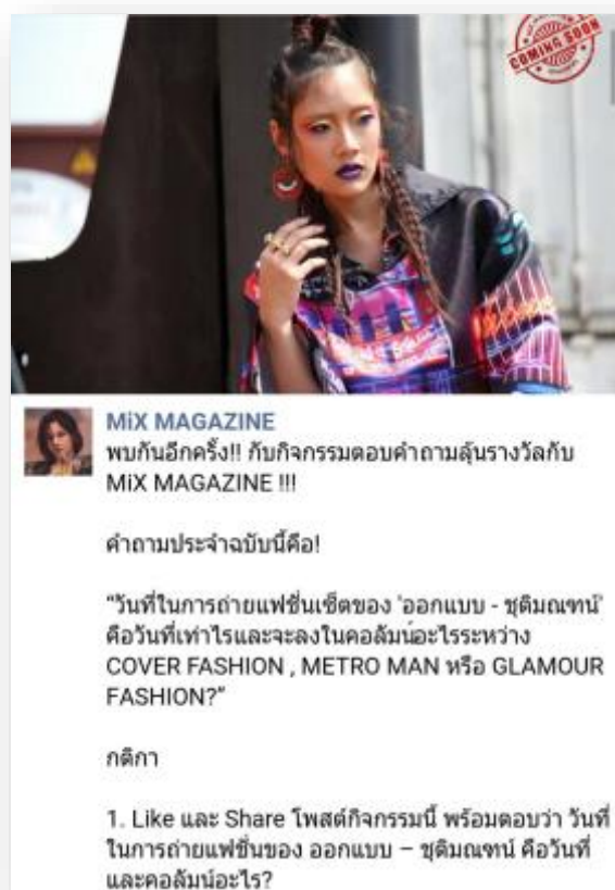
4.3 รูปตัวอย่างกิจกรรมของช่วงกลางเดือนมิถุนายน เพื่อโปรโมทแฟนเพจ