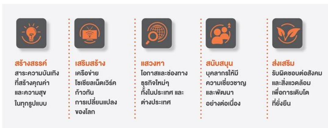
รูปที่ 3.2 พันธกิจบริษัท โมโนเทคโนโลยี จำกัด (มหาชน)

บริษัท โมโนเทคโนโลยี จำกัด (มหาชน) ก่อตั้งเมื่อวันที่ 28 พฤษภาคม 2545 โดยนายพิชญ์ โภธารามิก บริษัท โมโนเทคโนโลยี จำกัด (มหาชน) หรือ โมโนกรุ๊ป (MONO GROUP) มุ่งเน้นเป็นผู้นำด้านความบันเทิงแบบครบวงจร ผ่านเทคโนโลยี และสื่อที่หลากหลาย เพื่อตอบสนองทุกไลฟ์สไตล์ในโลกดิจิทัล บริหารงานภายใต้ค่านิยมหลักขององค์กร ประกอบด้วย การทำงานเป็นทีม ความคิดริเริ่มสร้างสรรค์ การเรียนรู้และพัฒนาอย่างต่อเนื่องเพื่อให้บรรลุพันธกิจที่บริษัทมุ่งเน้น