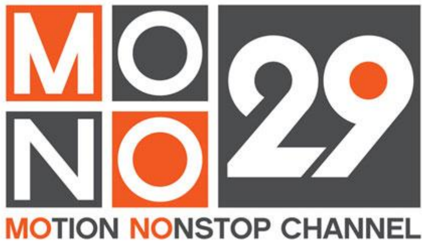
รูปที่ 3.7 Logo ช่องโทรทัศน์ MONO29