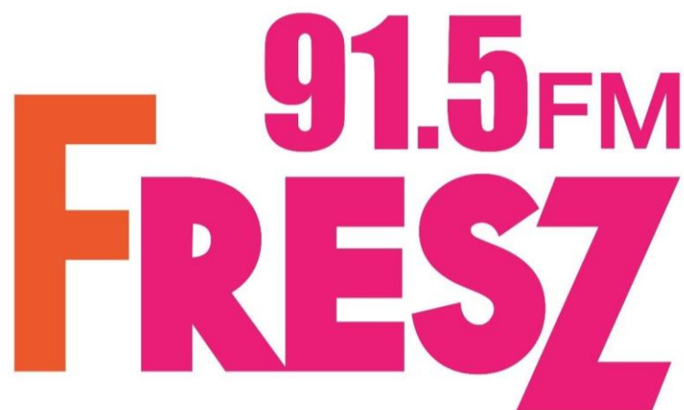
รูปที่ 3.9 Logo สถานีวิทยุ Mono Fresh 91.5