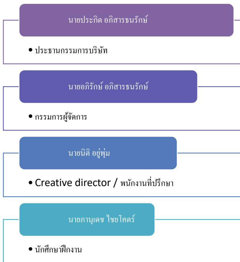
รูปภาพที่ 3.8 แผนภูมิการจัดองค์กรและการบริหารงานบริษัท ประกิต แอดเวอร์ไทซิ่ง จำกัด