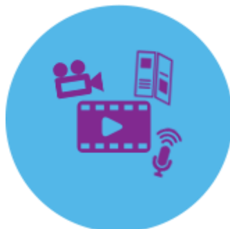
รูปภาพที่ 3.7 การบริการขององค์กร

ดิจิทัล ทุกวันนี้ เราพบผู้บริโภคได้ทุกที่ สิ่งสำคัญคือไม่ว่าจะพบแบรนด์ของเราที่ไหน ผู้บริโภคควรจะได้รับข้อมูลสื่อสารที่มีพลังและสอดคล้องเป็นหนึ่งเดียว และจากการสร้างแบรนด์ให้มีชีวิต เรากำลังทำให้ผู้บริโภครู้สึกคาดไม่ถึงทุก ๆ ครั้งที่ได้รับสื่อสาร จะเปรียบไปก็เหมือนการได้พบกับเพื่อนเก่าแก่ที่คุ้นเคยกันมานาน