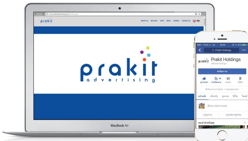
รูปภาพที่ 3.3 ช่องทางติดต่อบริษัทผ่าน www.prakadvertising.com และ www.facebook.com/PrakitHoldings