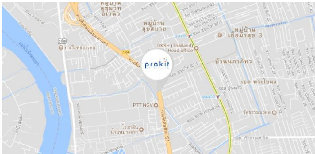
รูปภาพที่ 3.2 แผนที่ของ บริษัท ประกิต แอดเวอร์ไทซิง จำกัด